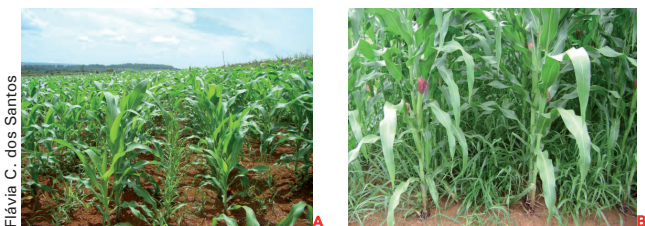
Figura 1. Braquiária na entrelinha do milho (A) (35 dias após o plantio do milho) e braquiária na linha + entrelinha do milho (B) (68 dias após o plantio do milho).

Após a colheita do milho, o terreno ficou em pousio, com a cultura da braquiária, que foi dessecada no verão antes do plantio da soja em rotação. No plantio da soja, utilizou-se a cultivar BRS Valiosa RR, no mesmo espaçamento do milho e população de 240.000 plantas por hectare. No ano seguinte, plantou-se novamente o milho com a braquiária.