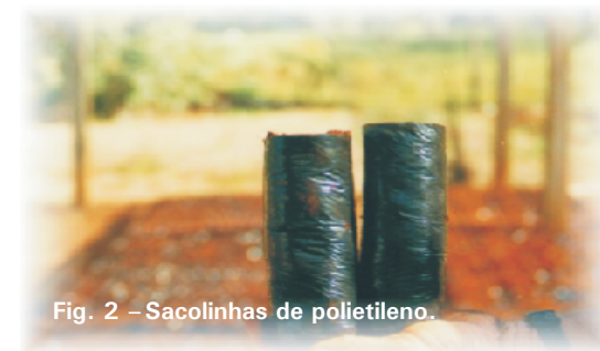
Fig. 2 - Sacolinhas de polietileno.

As sacolinhas são de polietileno, com furos da metade para baixo, possibilitando a drenagem do excesso de água. No mercado encontram-se dois tamanhos, 10 cm x 20 cm x 0,006 cm e 11 cm x 20 cm x 0,006 cm.