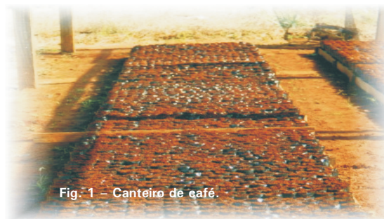
Fig. 1 - Canteiro de café.

Em 1 m 2 acomodam-se 256 sacolinhas com dimensões de 10 x 20 cm ou 196 de 11 x 22 cm.