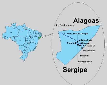
Figura 1. Mapa representando a localização da Região do Baixo São Francisco.

Cultiva-se arroz na Região do Baixo São Francisco (BSF), área situada nos estados de Alagoas e Sergipe (Figura 1), há décadas. Inicialmente, destinava-se apenas ao consumo próprio, mas após a entrada da Companhia de Desenvolvimento dos Vales do São Francisco e Parnaíba (Codevasf), tornou-se, socioeconomicamente, um dos produtos mais importantes da região.