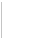
Figura 2 - Etanol nos Estados Unidos: uso de milho

Em 2005, cerca de 36,3 milhões de toneladas ou 12% da safra de milho dos Estados Unidos já havia sido destinada para a produção de etanol. Na safra 2007/2008 a previsão é de que 83,2 milhões de toneladas tenham o mesmo fim (Figura 2).