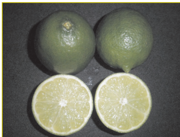
Limeira ácida 'Persian 58'

O Brasil é o quinto maior produtor mundial do grupo lima/limão, com uma área cultivada superior a 42 mil hectares. Dessa área, 74% localizam-se na região Sudeste, com predominância no Estado de São Paulo, vindo o Nordeste em segundo lugar com uma área de 6 mil hectares principalmente no Estado da Bahia. A lima ácida 'Tahiti' [ Citrus latifolia (Yu.Tanka) Tanaka] é a quinta fruta mais exportada do Brasil e se constitui em uma das mais expressivas dentre as cítricas. As condições tropicais predominantes na região Nordeste conferem-na vantagens competitivas quando comparada às outras regiões produtoras. Há, no entanto, desafios a serem superados notadamente em relação à oferta reprimida de clones e porta-enxertos. Considerando a necessidade de promover e proteger a produção de limas ácidas no Brasil, a Embrapa elegeu como uma das prioridades a obtenção e seleção de genótipos capazes de elevar a eficiência produtiva da limeira ácida 'Tahiti', especialmente no Nordeste brasileiro.