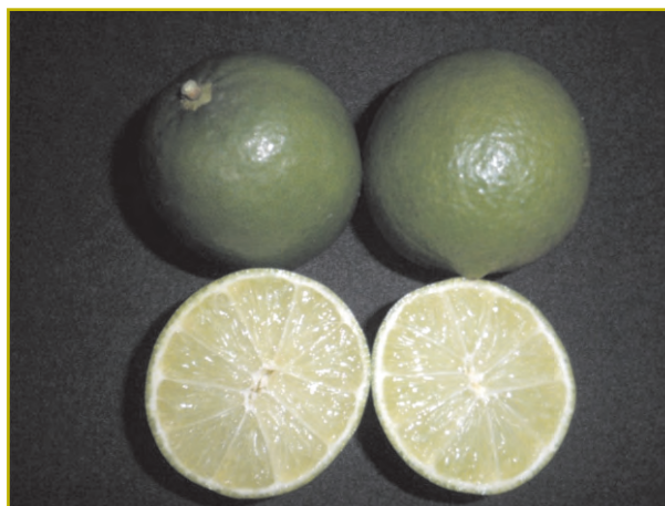
Limeira ácida 'Tahiti CNPMF 01'

O Brasil é o quinto maior produtor mundial do grupo lima/limão, com uma área cultivada superior a 42 mil hectares. Dessa área, 74% localizam-se na região Sudeste, com predominância no Estado de São Paulo, vindo o Nordeste em segundo lugar com uma área de 6 mil hectares principalmente no Estado da Bahia. A lima ácida 'Tahiti' [ Citrus latifolia (Yu.Tanka) Tanaka] é a quinta fruta mais exportada do Brasil e se constitui em uma das mais expressivas dentre as cítricas. As condições tropicais predominantes na região Nordeste conferem-na vantagens competitivas quando comparada às outras regiões produtoras. Há, no entanto, desafios a serem superados notadamente em relação à oferta reprimida de clones e porta-enxertos. Considerando a necessidade de promover e proteger a produção de limas ácidas no Brasil, a Embrapa elegeu como uma das prioridades a obtenção e seleção de genótipos capazes de elevar a eficiência produtiva da limeira ácida 'Tahiti', especialmente no Nordeste brasileiro.