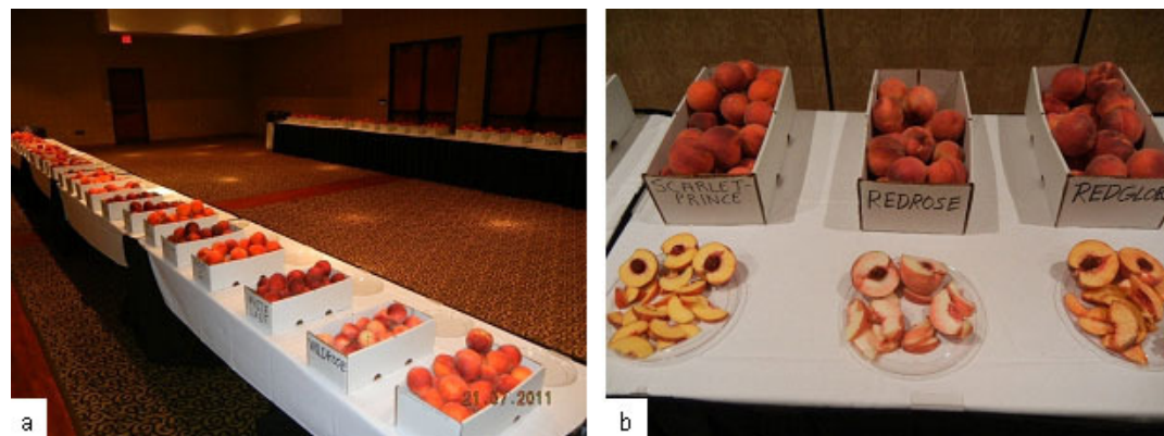
Figura 2. a) Exposição de pêsesgos de aproximadamente 50 cultivares no "Dia de campo do pêsego", promovido pela Universidade de Clemson, em Clemson, Carolina do Sul-EUA; b) cultivares de pêsego para degustação.

As cultivares de pessegueiro mais cultivadas no Sudeste dos Estados Unidos apresentam características próprias para o mercado in natura (aproximadamente 95% destinam-se a este mercado) e são, em sua maioria, de polpa amarela (aproximadamente 95% da produção) e de caroço solto (aproximadamente 80% da produção). Mais de 50 cultivares são exploradas comercialmente na região Sudeste americana e o período de colheita é bastante longo (cerca de 18 semanas), que inicia em maio e perdura até meados de setembro. Em geral, os frutos dessas cultivares chamam bastante atenção pelo bom tamanho, elevado teor de sólidos solúveis, excelente sabor e intensa coloração vermelha da epiderme (Figura 2). Diversas informações sobre as características dessas cultivares podem ser obtidas em: http://www.clemson.edu/hort/peach/index.php?p=73