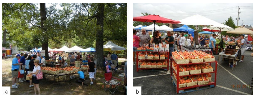
Figura 3. a) Comercialização de pêssigos in natura na 41ª Festa do Pêssego em Trenton, Carolina do Sul-EUA; b) comercialização de pêssigos in natura na Festa do Pêssego de Gaffney, Carolina do Sul-EUA.

Todos os anos são realizadas, na Carolina do Sul, pelo menos duas festas do pêssigo. Em Trenton, no ano de 2011, foi realizada a 41ª edição ( www.ridgepeachfestival.com ) e, em Gaffney, o evento é realizado desde 1976 ( http://www.scpetchfestival.org ) (Figura 3). Ambos os eventos contam com programação bastante diversificada e atrações para o público.