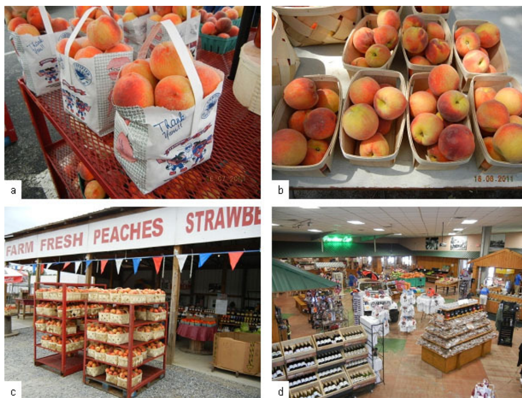
Figura 1. a) Comercialização de pêssegos in natura em sacolas de papel (Gaffney, Carolina do Sul-EUA); b) comercialização de pêssegos in natura em cestas artesanais (Trenton, Carolina do Sul-EUA); c) mercado de beira de estrada em Gaffney, Carolina do Sul-EUA, ilustrando comercialização de pêssegos in natura em cestas artesanais; d) mercado de beira de estrada pertencente à "Lane Southern Farms", em Fort Valley, Geórgia-EUA, que comercializa diversos produtos, especialmente à base de pêssego e noz-pecã.

É importante também destacar o trabalho de mulheres e de jovens - normalmente pertencentes à família proprietária - nesses mercados de beira-de-estrada, que tornam o atendimento ao público ainda mais amigável, aumentando os laços entre o consumidor e a família proprietária do pomar. Deve-se registrar, também, a importância da segurança pública, para que esses mercados de beira-de-estrada tenham plenas condições de funcionar adequadamente. O consumidor, por sua vez, já é conhecedor da qualidade dos produtos (notadamente o pêssego) e em que época do ano pode encontrar frutas frescas de qualidade. Essa relação elimina o "atravessador", tornando a atividade altamente lucrativa para o produtor. Talvez esse seja o principal fator de sucesso econômico da atividade persícola na região.