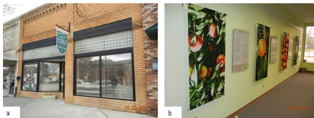
Figura 5. a) Museu do Pêsego, em Johnston, na Carolina do Sul-EUA; b) A história da cultura do pessegueiro no Sudeste dos Estados Unidos, contada no Museu do Pêsego.

A pequena cidade de Johnston, na Carolina do Sul, foi considerada a capital mundial do pêsego, na década de 1960. Nesta cidade, o poder público local criou o Museu do Pêsego, com o objetivo de valorizar esta importante cultura na região e disponibilizar um local com informações sobre a história do pêsego no Sudeste dos Estados Unidos (Figura 5).