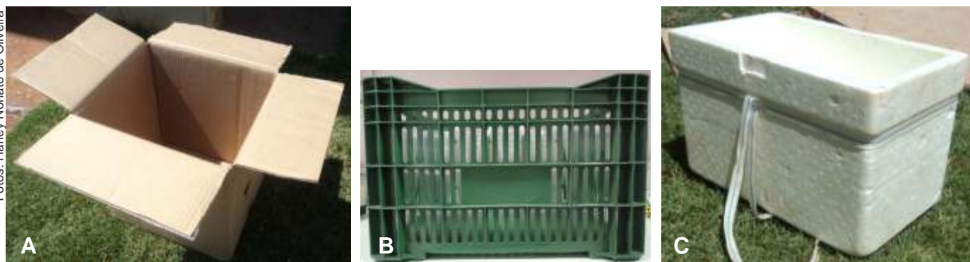
Figura 3. Formas de transporte de Cotesia flavipes para o campo. Copos armazenados em caixa de papelão (A), em engradados plásticos (B) e em caixas de isopor (C).