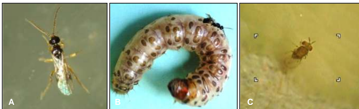
Figura 2. Parasitoides da broca-da-cana-de-açúcar: Cotesia flavipes (A); C. flavipes parasitando a lagarta de Diatraea saccharalis (B); Trichogramma galloi parasitando ovos de D. saccharalis (C).

Entre os principais inimigos naturais para controle de D. saccharalis , destacam-se os parasitoides Cotesia flavipes (Hymenoptera: Braconidae) e Trichogramma galloi (Hymenoptera: Trichogrammatidae), que têm sido utilizados com sucesso no controle da broca-da-cana-de-açúcar. O parasitoide larval C. flavipes é um dos maiores casos de sucesso de controle biológico no mundo e tem sido largamente utilizado em plantios comerciais da cana-de-açúcar (Figura 2 A e B). Já o parasitoide de ovos T. galloi é um dos mais estudados e apresenta a vantagem de controlar a praga antes da eclosão da lagarta (Figura 2 C) (BOTELHO et al., 1995; PINTO, 2010; PINTO et al., 2006).