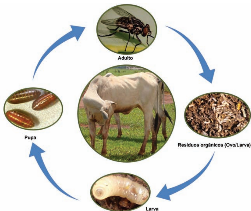
FIGURA 12.1 - Ciclo de vida básico de moscas hematófagas

A mosca-dos-chifres passa quase todo o tempo alimentando-se sobre os bovinos, saindo apenas para colocar seus ovos, que são depositados em fezes frescas de bovinos. Ao contrário da mosca-dos-chifres, a mosca-dos-estábulo passa a maior parte do tempo fora do hospedeiro. Ela só vai até os animais para se alimentar, fica alguns minutos e depois procura um local protegido para repousar. Essa espécie utiliza matéria orgânica preferencialmente em estado de fermentação para se reproduzir (Quadro 12.1).