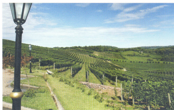
Figura 7. Videira do cv. Merlot conduzido em espaldeira, no Vale dos Vinhedos, Bento Gonçalves, RS. (Foto: Alberto Miele).