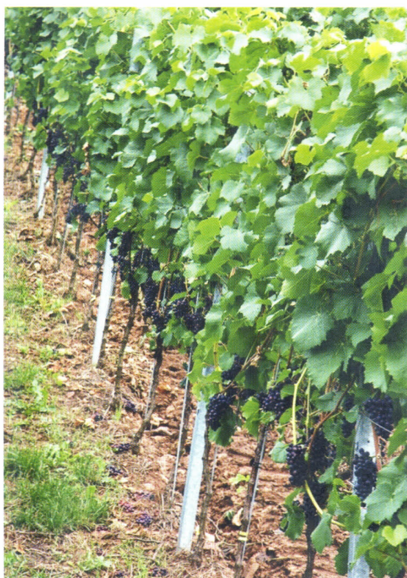
Figura 5. Videira do cv. Pinot Noir conduzido em espaldeira, na Francônia, Alemanha.