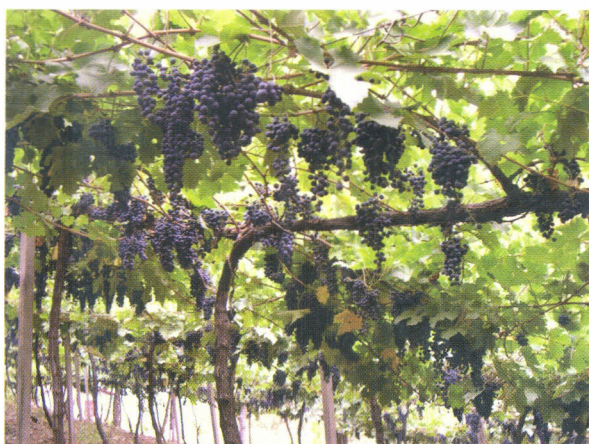
Figura 2. Vinhedo do cv. Cabernet Sauvignon, conduzido em latada, durante a maturação da uva, em Bento Gonçalves, RS.