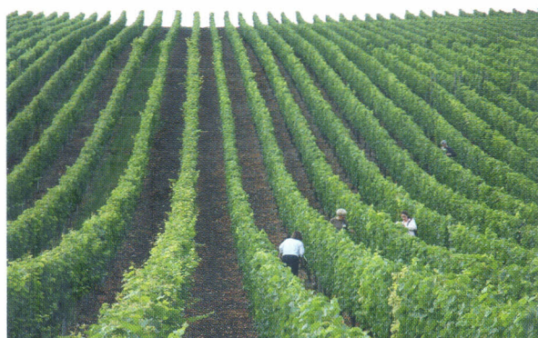
Figura 6. Videira do cv. Pinot Noir conduzido em espaldeira, na Francônia, Alemanha. (Foto: Alberto Miele).