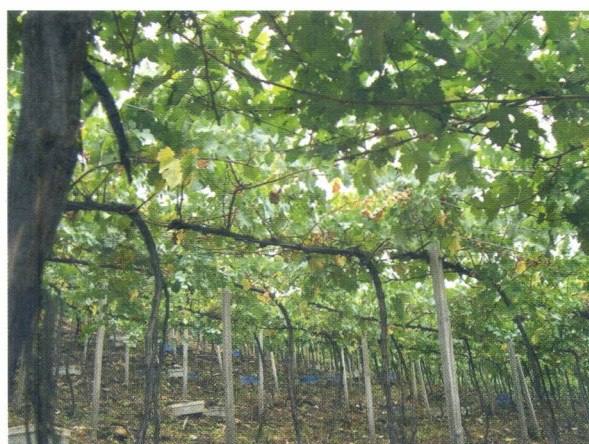
Figura 3. Vinhedo do cv. Cabernet Sauvignon, conduzido em latada, após a colheita da uva, em Bento Gonçalves, RS.