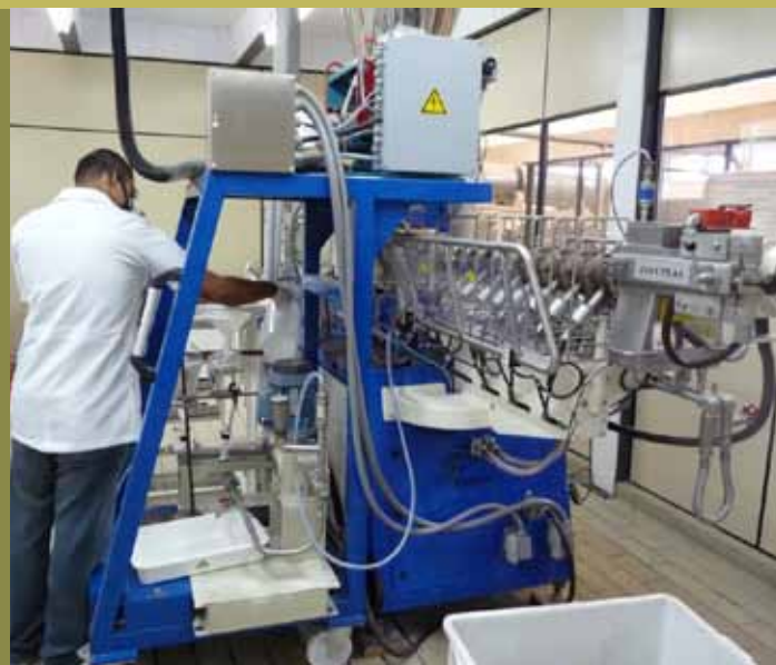
Extrusora Clextral HT 25 (Firminy, França)

Para possibilitar o uso da torta de pinhão-manso como ração animal, é imprescindível que seja feita a destoxificação. Alguns métodos químicos e físicos foram testados, porém ainda não existe nenhuma metodologia eficaz no Brasil para destoxificação da torta. Faz-se necessário o desenvolvimento de processos eficientes e economicamente viáveis que possam ser empregados de maneira confiável na destoxificação da torta de pinhão-manso.