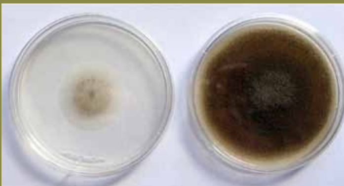
Fungos isolados da torta de pinhao-manso

Realizou-se um ensaio com 24 cordeiros machos da raça Santa Inês, na Fazenda Água Limpa, da Universidade de Brasília (UnB). Este ensaio teve duração de 90 dias, sendo os primeiros 30 dias para uniformização do peso e estado sanitário do lote. Nos demais 60 dias, a torta de pinhão-manso foi adicionada na dieta dos animais como fonte proteica em substituição ao