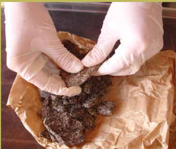
Torta de pinhão-manso após extração mecânica