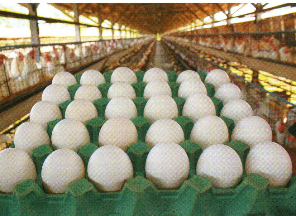
Alimentação e práticas de manejo das frangas influenciam a produção e a qualidade dos ovos

Durante a fase de 6 a 12 semanas de idade, ocorre o crescimento ósseo da ave (Kwakkel et al., 1993). Nesta fase, cuidados especiais com as fontes de cálcio e fósforo são fundamentais para se ter formação óssea adequada, até porque durante a fase de produção este tecido é extremamente importante para dar suporte à parcela de cálcio para a formação da casca bem como no controle homeostático sanguíneo durante a formação do ovo. Igualmente importante é o programa de luz adotado durante