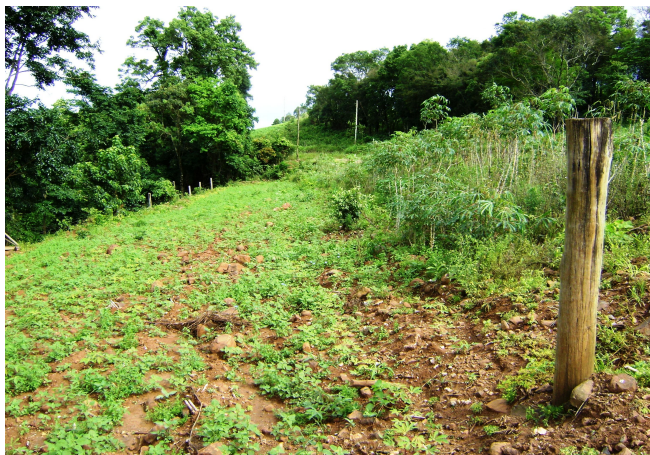
Fig 4: Contraste entre mata e roça, onde a primeira sempre acaba em capoeira e erosão da terra.