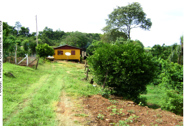
Fig 3: Casa de camponês nas bordas das encostas onde, a mata nativa é retirada para o estabelecimento das roças.