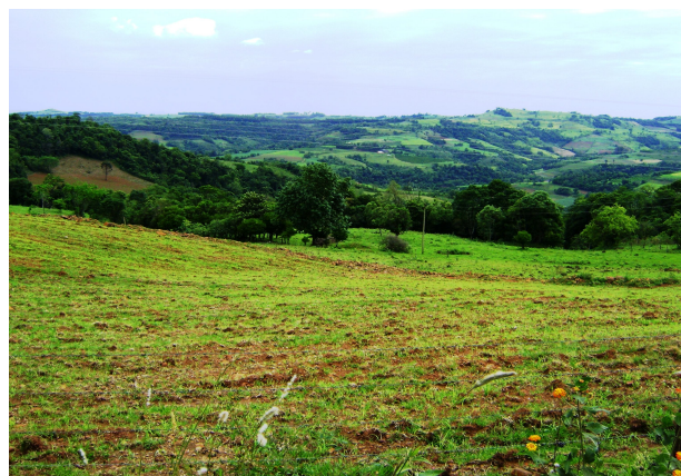
Fig 8: Cultivo em espigões sem proteção contra a erosão. Processo erosivo inicial.