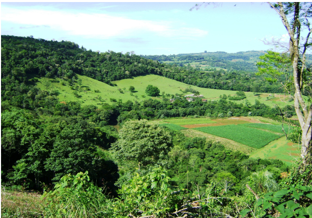
Fig 21: Sequência de fotos com o relevo e a transformação da mata em campos.