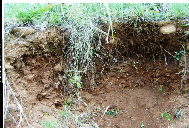
Fig 15: CAMBISSOLO HÁPLICO Ta Eutroférico saprolítico em deposições coluvias nas encostas.