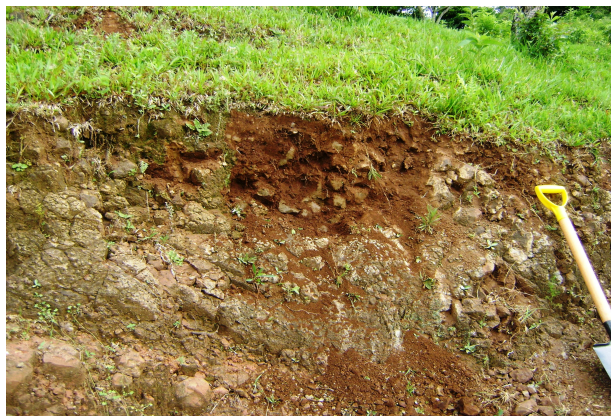
Fig 17: NEOSSOLO LITÓLICO Eutrófico fragmentário em encosta íngreme.