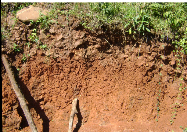
Fig 11: LUVISSOLO CRÔMICO Órtico cambissólico coberto com deposição coluvial holocênica saprolítica.