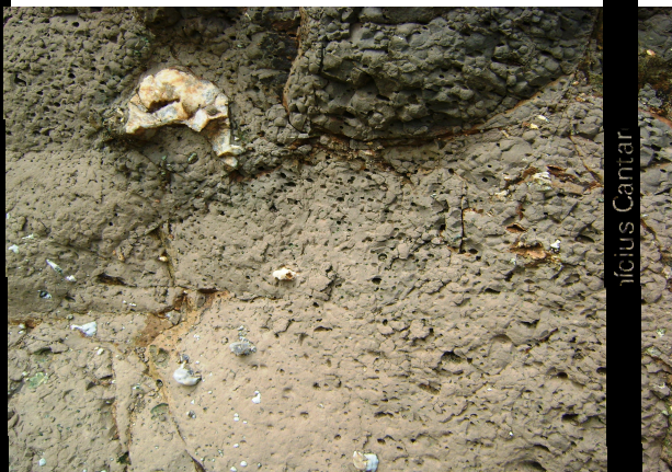
Fig 13: Camada de basalto escura própria das rochas máficas.