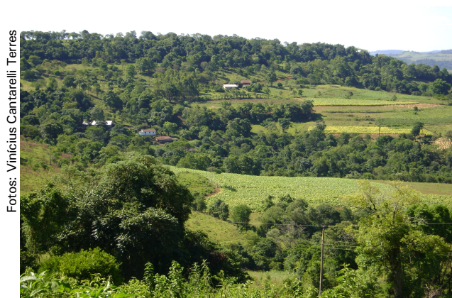
Fig 5: O uso conflitante entre os cultivos e a mata nativa, em fase inicial.

No início da primeira picada, construída pelos colonos na rota para Erval Seco no fim do platô, onde os campos eram limitados pela mata, constatou-se que a taquaruçu ( Bambusa trini ), grápia ( Apuleia leiocarpa ), canela-de-veado ( Helietta apiculata ), camboatá ( Matayba elaeagnoides ), canela-loura ( Ocotea spixiana ), açoita-cavalo ( Luehea divaricata ), cabriúva ( Myrocarpus frondosus ), canela-do-brejo ( Machaerium glabrum ), timbó ( Ateleia glazioviana ) e rabo-de-bugio ( Dalbergia frutescens ) compõem o início do relevo áspero escarpado e rochoso com solos pedregosos e rasos, onde a mata era densa (Fig.5 e 6).