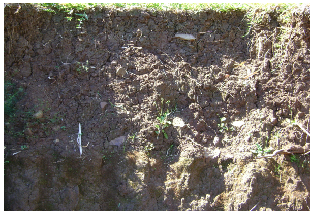
Fig 19: Deposições colúvias sobre solos antigos nas encostas das serras.