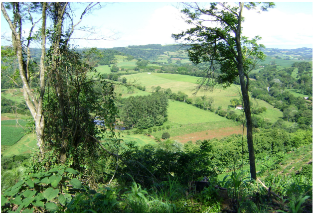
Fig 22: Sequência de fotos com o relevo e a transformação da mata em campos.