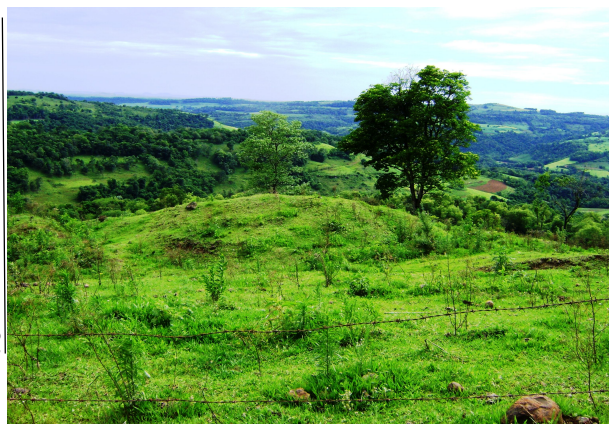
Fig 7: Espigões rochosos após o desmatamento e o uso agrícola. Atual pastagem