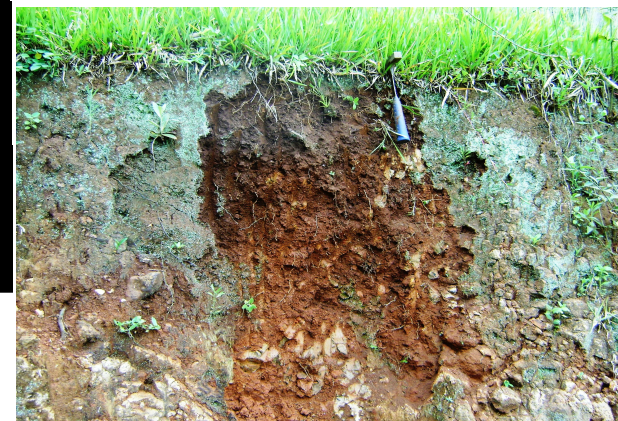
Fig 16: CHERNOSSOLO ARGILÚVICO Órtico cambissólico de ocorrências ocasionais.