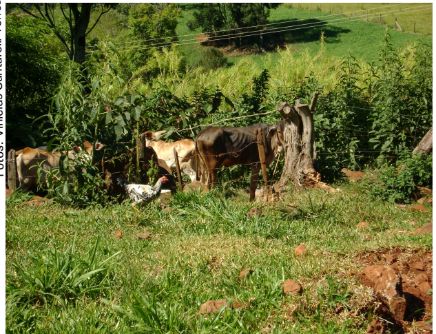
Fig 1: Agricultura familiar, a cada momento, modela-se para sua sobrevivência.