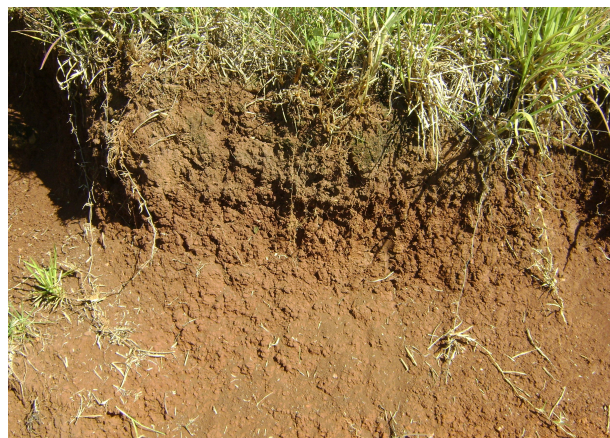
Fig 20: CHERNOSSOLO ARGILÚVICO Férrico saprolítico nas encostas dos vales.