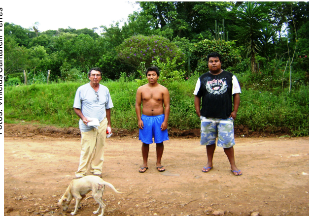
Fig 2: Índios da reserva indígena próxima a Iraí. Contemplativos, não percebem que são parte da história e que desta devem participar.