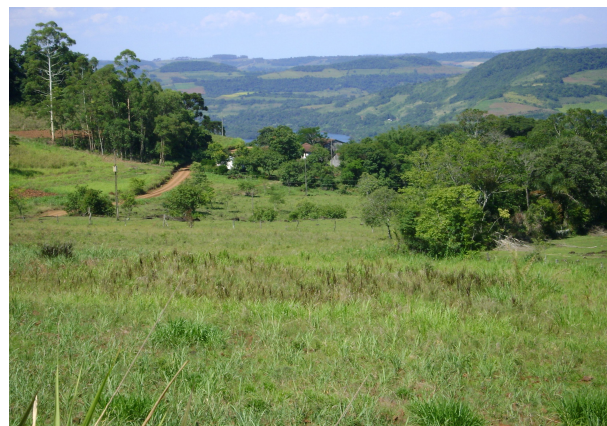
Fig 10: Encostas íngremes usadas com cultivos sem um controle erosivo.