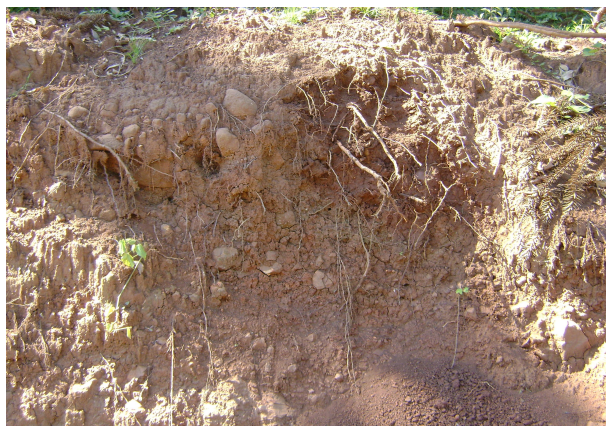
Fig 9: Solos coluviais incipientes na borda das encostas (CAMBISSOLO HÁPLICO Ta Eutroférico saprolítico).