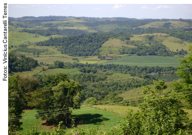
Fig 6: O uso generalizado das terras entre mata e as encostas íngremes seguem uma ordem definida.