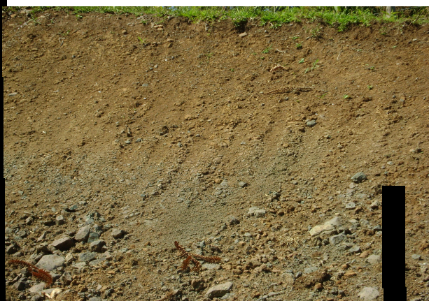
Fig 12: LUVISSOLO CRÔMICO Órtico lítico navariabilidade geral das deposições de basalto.