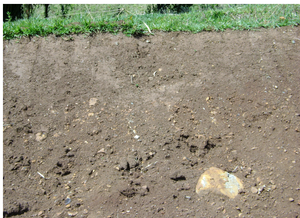
Fig 18: CHERNOSSOLO EBÂNICO Órtico vertissólico de ocorrência ocasional.