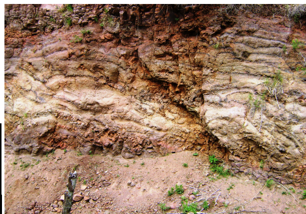
Fig 14: Camadas de basalto com estratificações distintas.