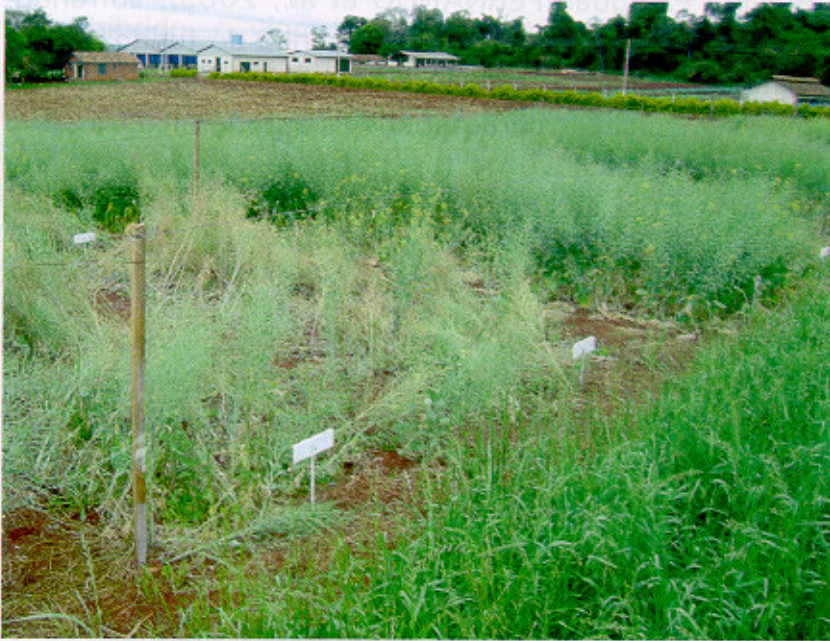
Fig. 1. Comportamento de genótipos em área com ocorrência de canela-preta: tombamento e perdas totais de praticamente todas as plantas de genótipos suscetíveis à canela-preta (duas parcelas situadas a esquerda da foto) e plantas de híbridos resistentes intactas (lado direito e ao fundo).

tência derivada de Brassica rapa ssp sylvestris , a qual, segundo o Dr. Greg Buzza 1 , provavelmente está associada a apenas três genes.