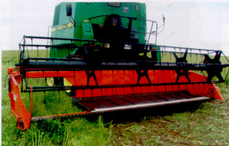
Fig. 9. Plataforma acoplada à colhedora-automotriz, específica para corte-enleiramento de canola (e cereais), fabricada no RS.