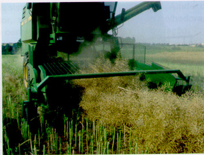
Fig. 11. Plataforma recolhadora das leiras, após a secagem.