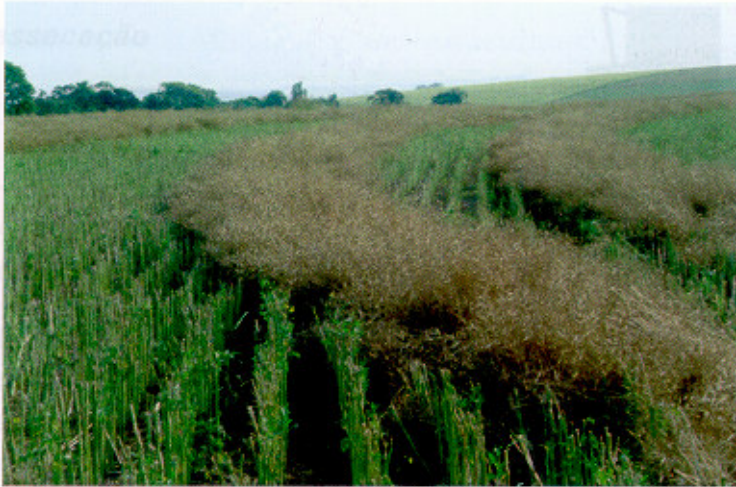
Fig. 8. Lavoura de canola cortada-enleirada, com plantas suspensas sobre os caules das plantas permitindo o escoamento de umidade e a ventilação sob a leira, para facilitar a secagem.