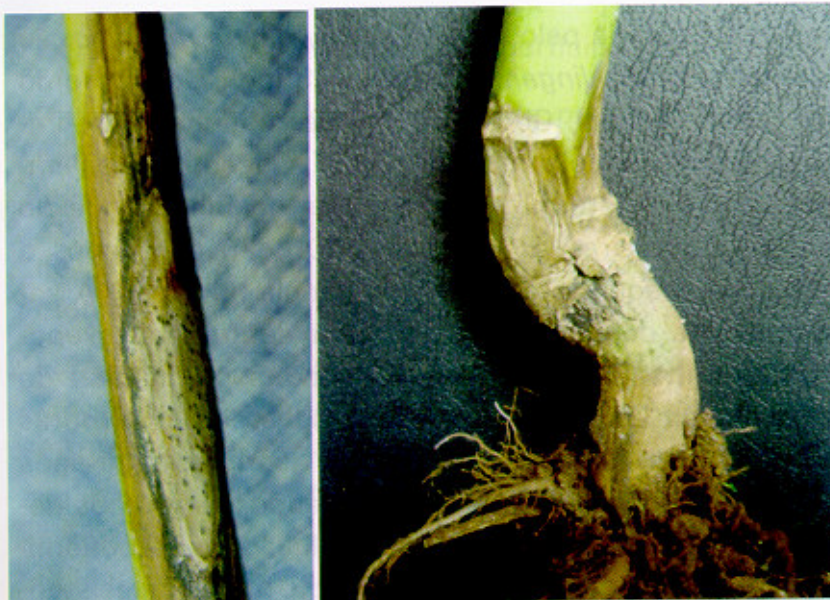
Fig. 4. Sintomas típicos de canela-preta na base de caules de plantas de canola, geralmente mais visíveis a partir da floração, causados pelo crescimento do micélio desenvolvido a partir de lesões em folhas cotiledonares.