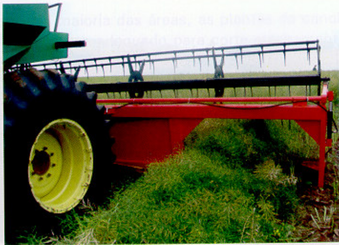
Fig. 10. Vista da abertura lateral traseira da plataforma, para onde as plantas cortadas são levadas pela esteira de borracha, a qual pelo movimento transversal em relação ao sentido do movimento da colhedora, as enleira.