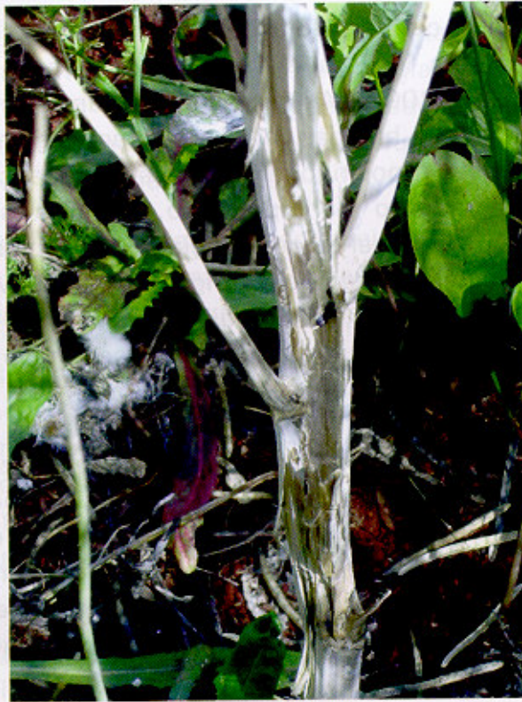
Fig. 6. Caule de planta de canola com tecidos mortos pela infecção de Sclerotinia sclerotiorum , presença de escleródio (estrutura preta, redonda no interior do caule morto) e micélio branco fofo, típico do fungo, sobre os caules.