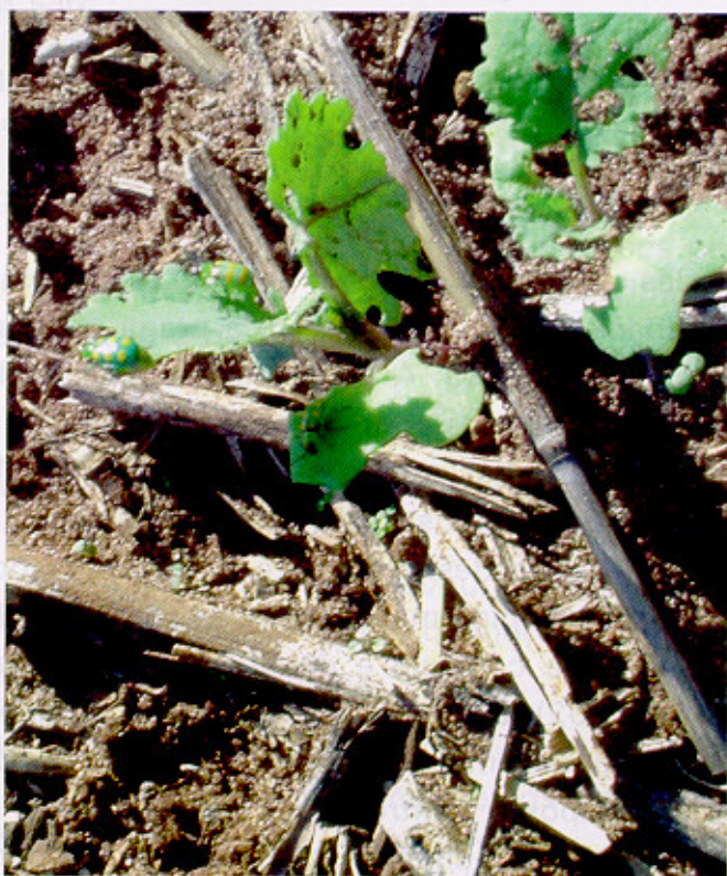
Fig. 3. Adultos de Diabrotica speciosa e respectivos danos à plântulas de canola, poucos dias após a emergência.

A vaquinha ou patriota ( Diabrotica speciosa ) é uma praga que ataca muitas culturas e causa desfolha em canola, especialmente da fase cotiledonar até 2-3 folhas verdadeiras (Figura 3). Os danos são mais frequentes em lavouras semeadas no início do período recomendado. Em determinadas lavouras o tratamento de sementes com inseticidas permitiu proteger as plântulas por até 20 dias.