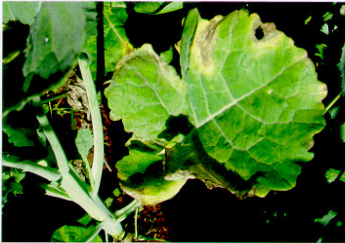
Fig. 7. Sintomas da bacteriose concentrado na periferia da folha, pois a bactéria penetra nestes tecidos através dos hidatódios de superfícies com água livre, a qual geralmente se acumula nas bordas das folhas.