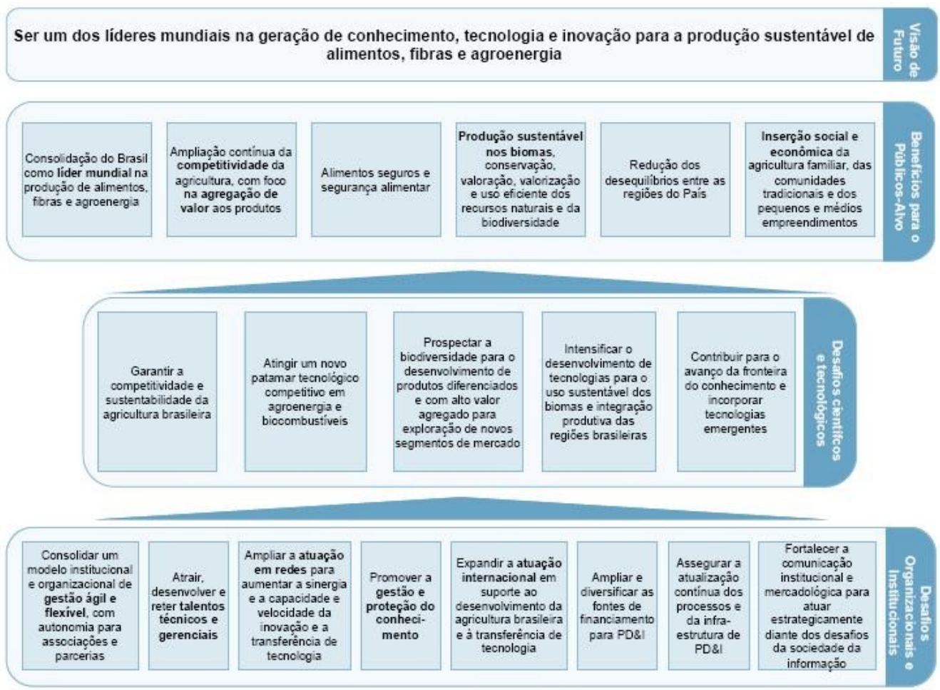
Fig. 3. Posicionamento estratégico da Embrapa (V PDE 2008-2011-2023).