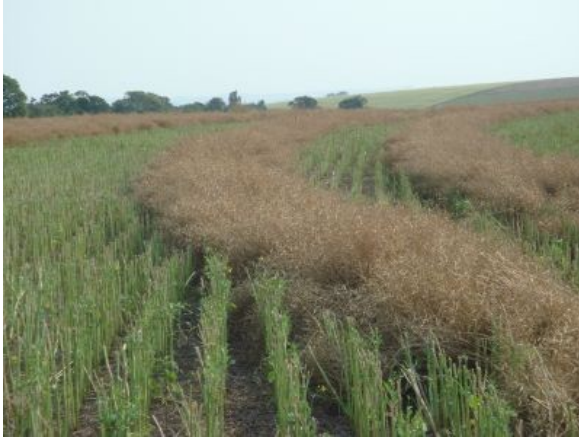
Fig. 8. Lavoura de canola cortada-enleirada, com plantas suspensas sobre os caules das plantas permitindo o escoamento de umidade e a ventilação sob a leira, para facilitar a secagem.