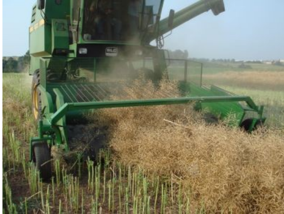
Fig. 11. Plataforma recolhadora das leiras, após a secagem.