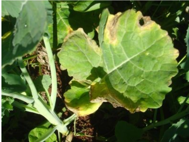
Fig. 7. Sintomas da bacteriose concentrado na periferia da folha, pois a bactéria penetra nestes tecidos através dos hidatódios de superfícies com água livre, a qual geralmente se acumula nas bordas das folhas.