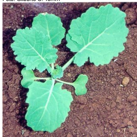
Fig. 2. Ponto ideal para aplicação de nitrogênio em cobertura: quatro folhas verdadeiras (as duas folhas cotiledonares, provenientes da semente, não são incluídas na contagem).

Quadro 7. Concentração de nutrientes em fertilizantes nitrogenados.