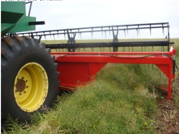
Fig. 10. Vista da abertura lateral traseira da plataforma, para onde as plantas cortadas são levadas pela esteira de borracha, a qual pelo movimento transversal em relação ao sentido do movimento da colhedora, as enleira.