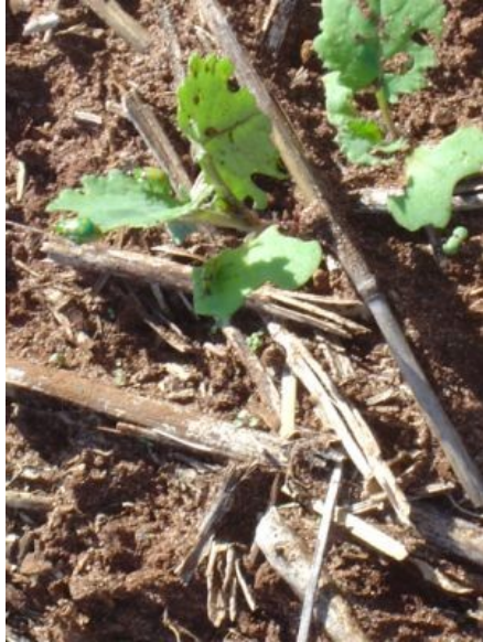
Fig. 3. Adultos de Diabrotica speciosa e respectivos danos à plântulas de canola, poucos dias após a emergência.