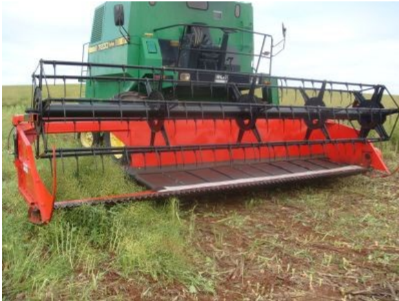
Fig. 9. Plataforma acoplada à colhedora-automotriz, específica para corte-enleiramento de canola (e cereais), fabricada no RS.