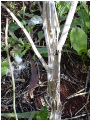
Fig. 6. Caule de planta de canola com tecidos mortos pela infecção de Sclerotinia sclerotiorum , presença de escleródio (estrutura preta, redonda no interior do caule morto) e micélio branco fofo, típico do fungo, sobre os caules.