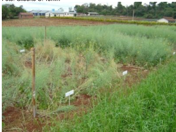
Fig. 1. Comportamento de genótipos em área com ocorrência de canela-preta: tombamento e perdas totais de praticamente todas as plantas de genótipos suscetíveis à canela-preta (duas parcelas situadas a esquerda da foto) e plantas de híbridos resistentes intactas (lado direito e ao fundo).