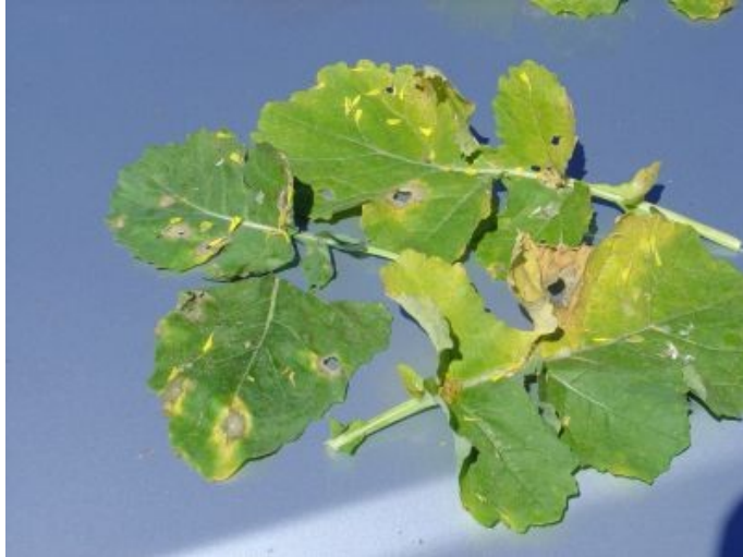
Fig. 5. Sintomas de Phoma lingam (forma assexuada) a qual produz picnidiosporos sobre tecidos vivos e mortos, infecta apenas plantas adultas, por respingo de gotas de água sobre outras partes da planta ou plantas vizinhas até raio de até 1,35 m, e possui pouco efeito sobre o rendimento de grãos.