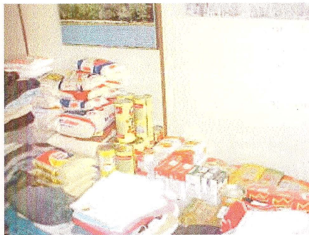
Alimentos arrecadados durante a Semana Solidária.

A semana de 22 a 25 de abril de 2003, quando da comemoração dos 30 anos da Embrapa, todas Unidades da Empresa estimularam seus funcionários e a população em geral a doarem alimentos não perecíveis, agasalhos, fraldas geriátricas, livros, e sangue. O evento foi denominado Semana Solidária e obteve-se grande arrecadação dos itens citados. Na Embrapa Pantanal o resultado dessa campanha foi a arrecadação de 190 Kg de alimentos não perecíveis, 263 peças de roupa e 49 livros, além da doação de sangue realizada por 9 pessoas. A Semana Solidária não foi apenas uma ação isolada, a intenção principal é que essas ações sejam incorporadas no cotidiano de cada um de nós.