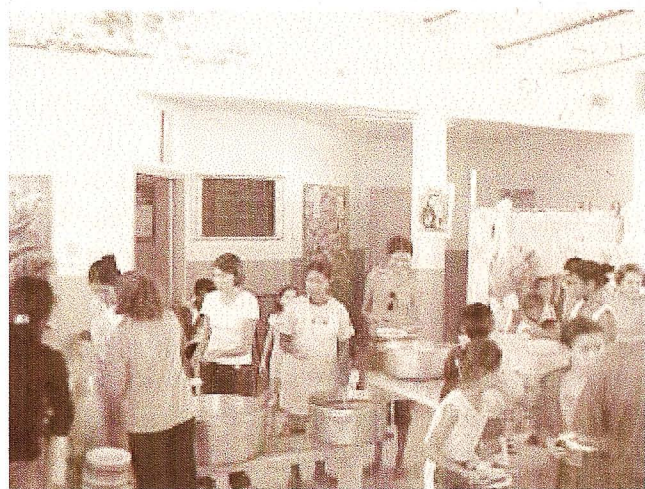
Distribuição de alimentos na Oficina Mãos Amigas Santo Antônio de Pádua.

A Embrapa Pantanal promove, freqüentemente, cursos, seminários, palestras, e outras atividades com a finalidade de transferência de tecnologias à população. Desde o mês de julho de 2003, adotou-se a prática de cobrar como inscrição para esses eventos um quilograma de alimento não perecível. A contribuição custa muito pouco para os participantes dos eventos, porém é muito significativa para as famílias necessitadas assistidas. Assim como no caso das arrecadações feitas pelos Amigos da Embrapa, todos os alimentos arrecadados nesses eventos são entregues para entidades assistências do município.