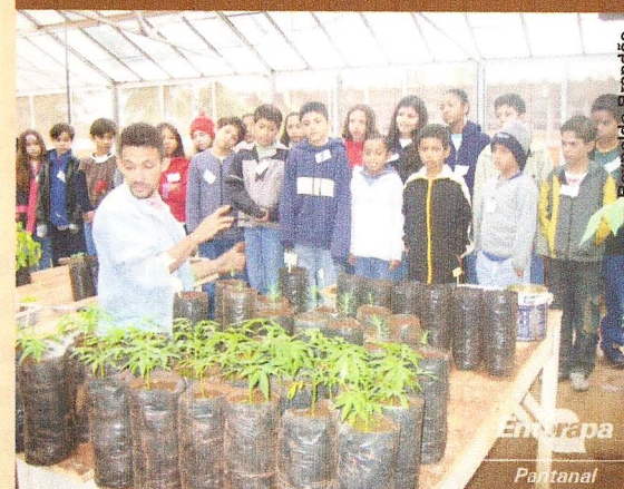
Visita à Casa de Vegetação da Embrapa Pantanal