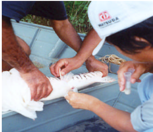
Coleta de sêmen de peixe.

O banco de sêmen utiliza a técnica de criopreservação, que é um método de estocagem por congelamento em nitrogênio líquido de células ou tecidos vivos a longo prazo.