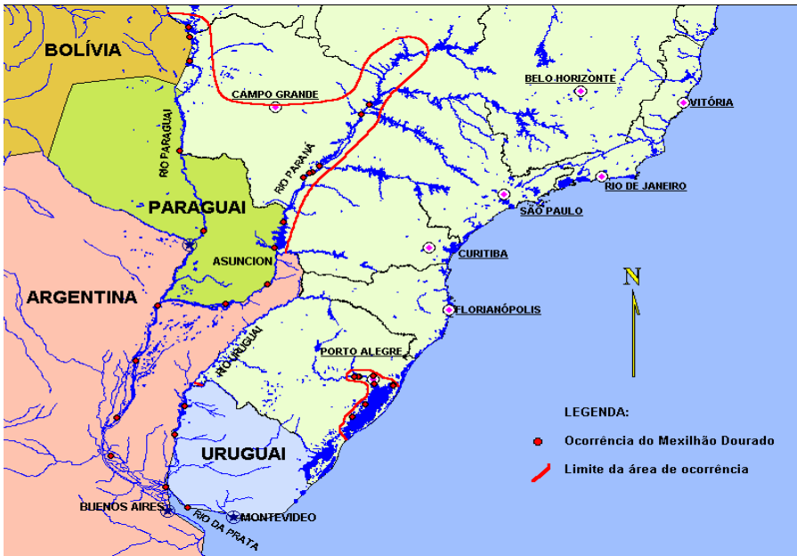
Fig. 1. Área de ocorrências do mexilhão dourado no Brasil

No Brasil, até o presente, a ocorrência de L. fortunei está descrita para as bacias dos rios Paraná, Paraguai, Uruguai e Lago Guaíba (Fig. 1).