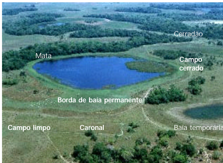
Fig. 2. Vista área parcial da área de estudo, onde são visualizados as diferentes fitofisionomias/idades de paisagem

estudos têm mostrado que este é um sistema apropriado para pastagens nativas.