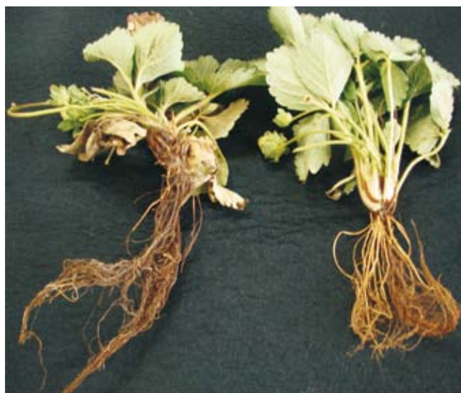
Fig. 4. Raízes de morangueiro doente (esquerda) e sadia (direita).

Pelas razões anteriormente citadas, a manutenção de um sistema radicular sadio é essencial para se obter um crescimento vigoroso das plantas durante todo o ciclo. Para que isto ocorra, o solo deve estar adequadamente preparado, com uma adubação equilibrada, boa aeração e irrigado de maneira correta. As raízes podem ser severamente danificadas por insetos, fungos patogênicos e nematóides, que limitam o seu desenvolvimento, limitam sua função de nutrir adequadamente as plantas e chegam a causar a morte das plantas.