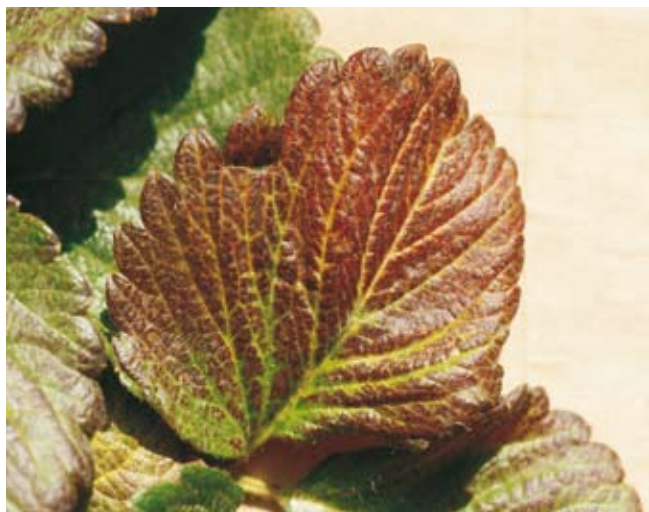
Fig. 5. O "vermelhão" do morangueiro é um sintoma que pode ser originado por várias causas.