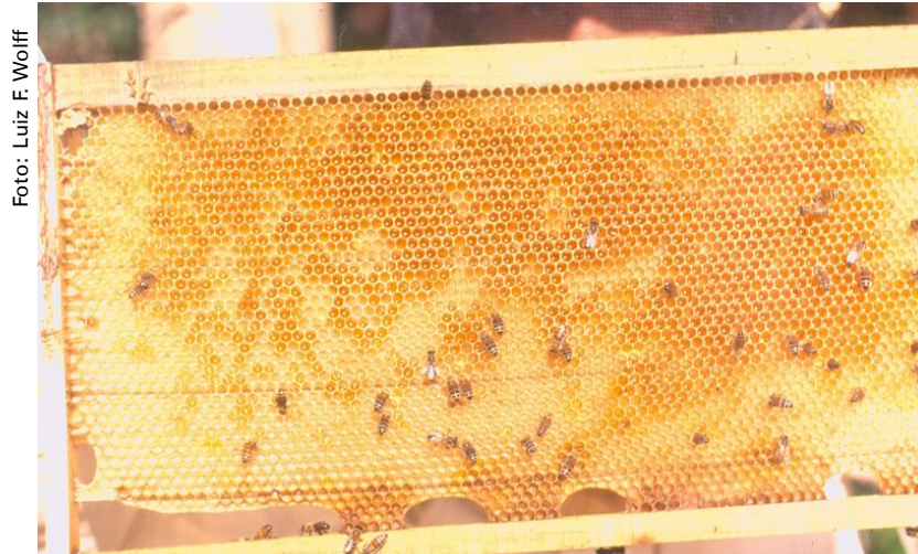
Figura 1. Favo de abelhas melíferas isento de traças-da-cera.