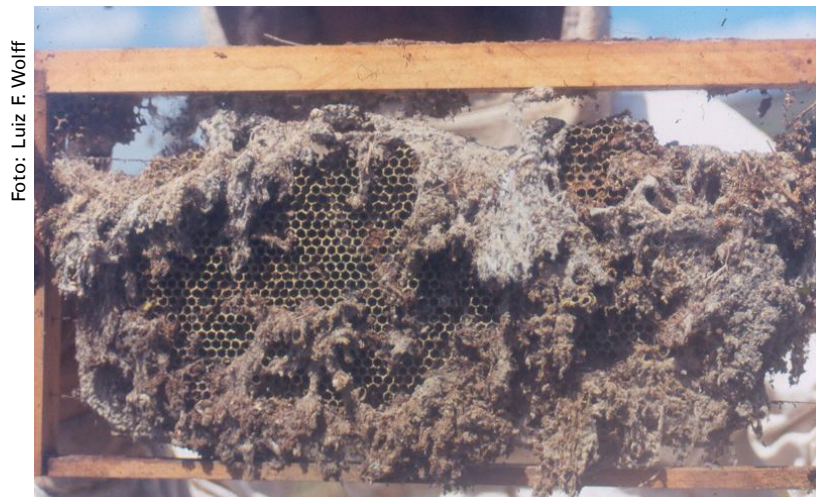
Figura 2. Favo de abelhas melíferas atacado por traças-da-cera.