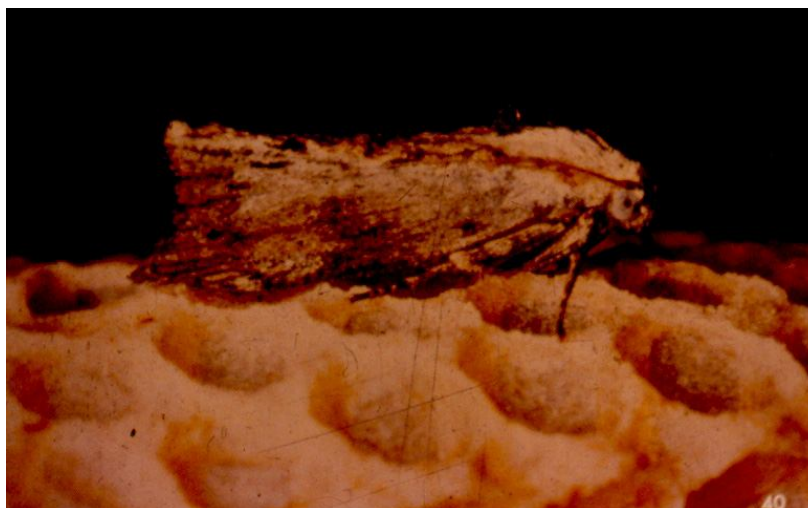
Figura 3. Adulto de traça-da-cera pousado sobre favo de abelhas melíferas.