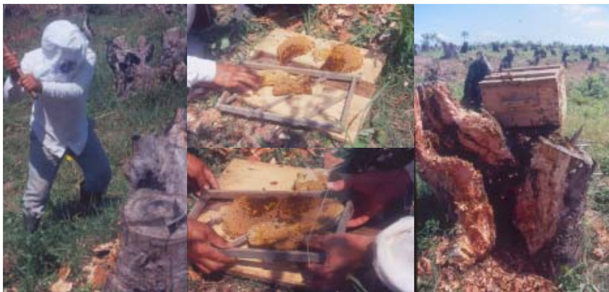
Figura 6. Remoção de enxame alojado em oco de árvore, corte e transferência dos favos para dentro de caixa com quadros, possibilitando manejos e produção de mel.

e) transferir a colméia 7 ou 10 dias mais tarde, para junto das demais num apiário a mais de 2 km, sempre no período da noite.