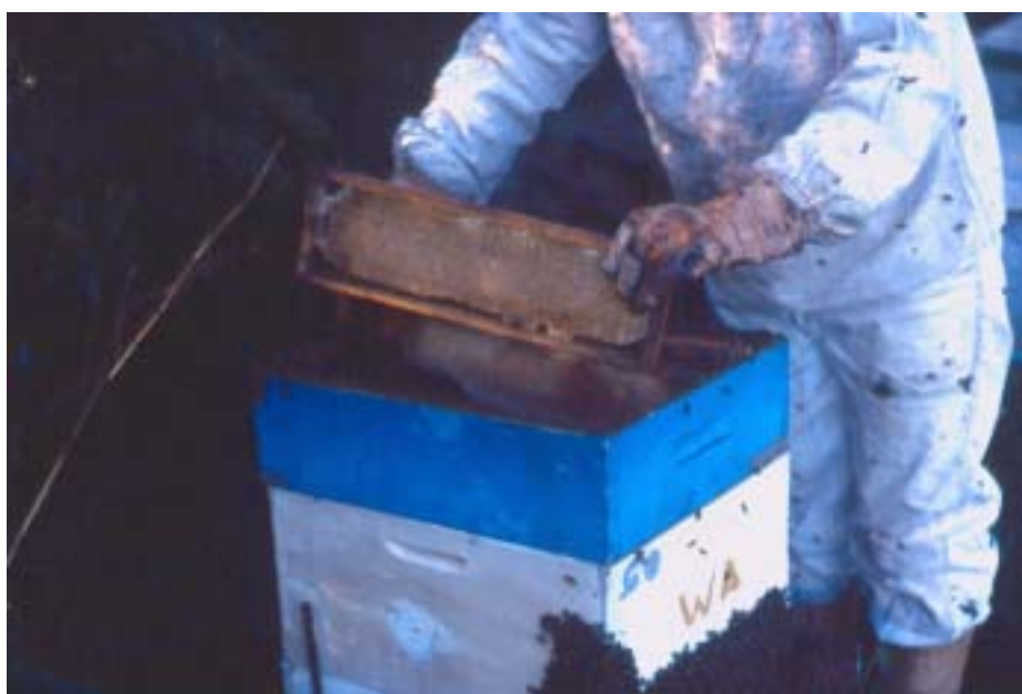
Figura 14. o momento da colocação da primeira melgueira é o mais crítico e exige um bom preparo inicial da colônia pelos apicultores.