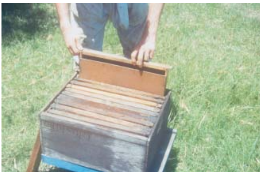
Figura 10. Alimentador tipo cocho sendo colocado na borda do ninho para acesso interno pelas abelhas durante a entressafra.

Reduzir os alvados e vedar as possíveis frestas de cada colméia. Revisar e fazer manutenção nos alimentadores (lavagem vigorosa) a cada reposição de alimento, para evitar o surgimento de fungos (mofo) e outros microorganismos. Não derramar alimentos pelo apiário, evitando pilhagem.