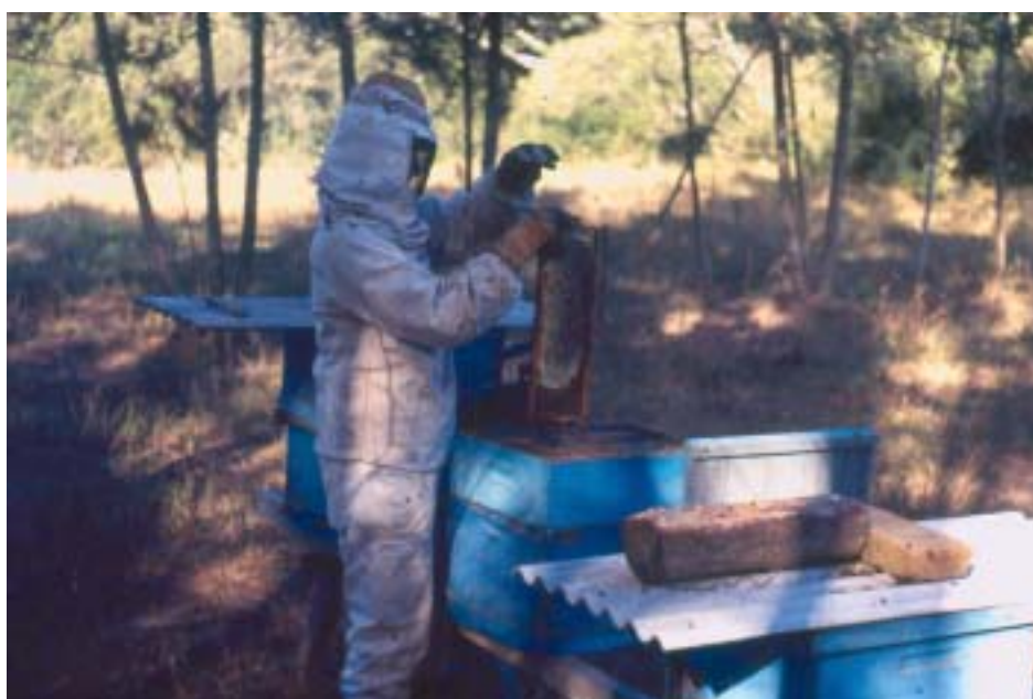
Figura 15. Durante a colheita dos favos com mel operculado, as abelhas aderentes ao mesmo são removidas de volta para a colméia.

Retire um por um os quadros da melgueira, remova as abelhas aderentes e passe imediatamente para dentro de uma melgueira vazia e tampada (melgueira de transporte). A melgueira que estava na colméia e ficou vazia, poderá ser removida e usada para receber os quadros da próxima colméia do apiário, ou poderá ficar no lugar e ser preenchida por outros caixilhos de melgueira com favos vazios ou lâminas inteiras de cera alveolada.