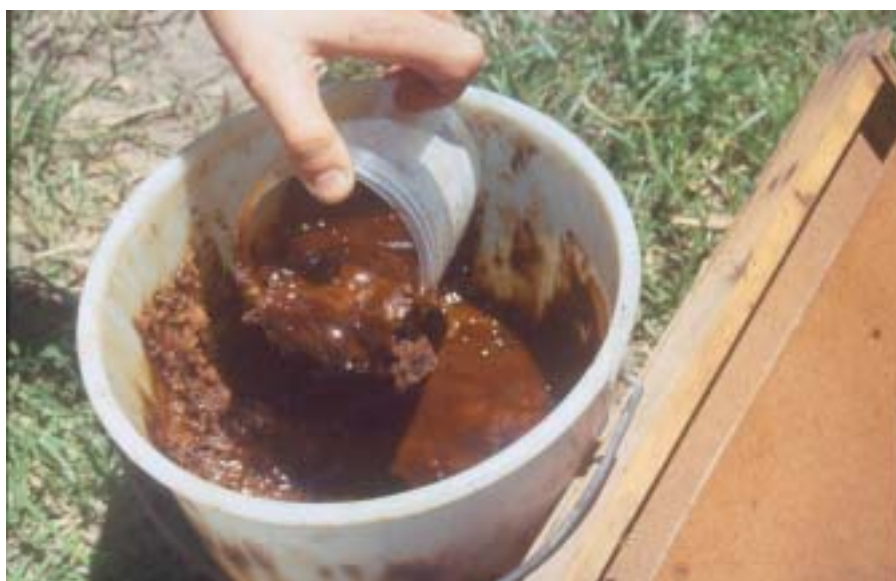
Figura 9. Alimentação artificial na forma pastosa: abastecendo alimentador tipo cocho.

Quando se pretende caracterizar o mel produzido nos apiários como oriundo de produção orgânica, nas alimentações artificiais os apicultores deverão usar exclusivamente mel próprio, açúcar mascavo ou mesmo branco, desde que de origem orgânica. Conservantes sintéticos são condenados na criação ecológica de abelhas e produção de mel orgânico.