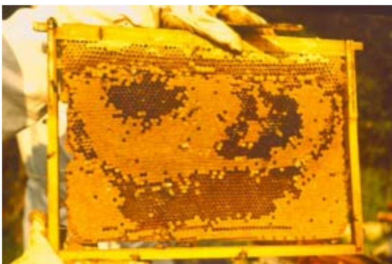
Figura 12. Favo com crias em diferentes estágios de desenvolvimento: as áreas escuras apresentam alvéolos com ovos e larvas, as áreas claras apresentam alvéolos operculados e com pupas no interior.

Preencher o restante dos espaços com quadros providos de lâminas inteiras de cera alveolada, tanto na colméia receptora quanto na doadora.