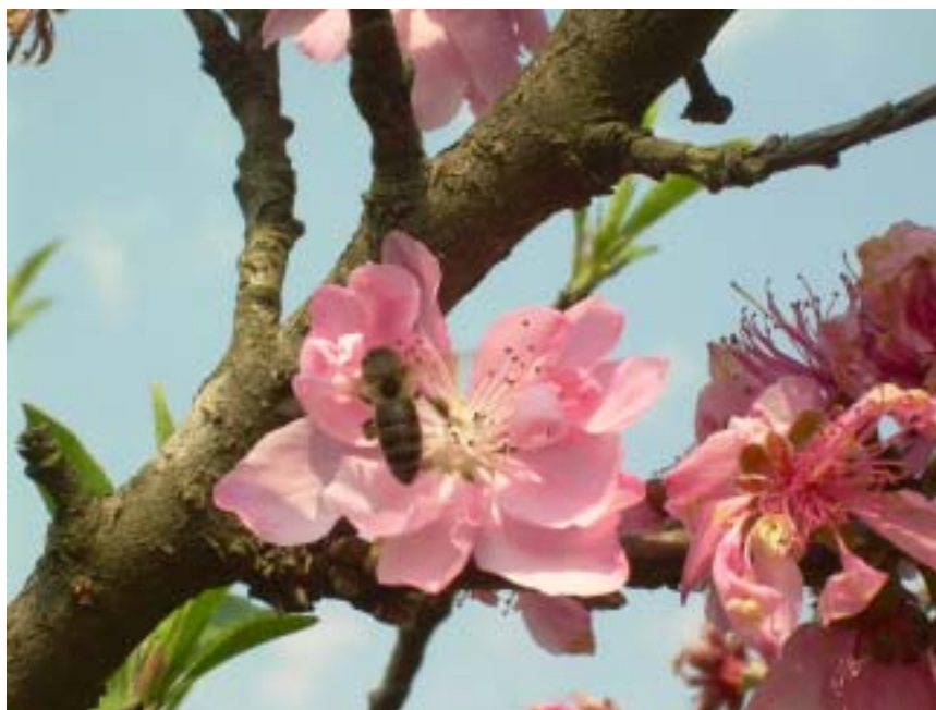
Figura 1. Durante sua visita às flores, as abelhas melíferas realizam a polinização.

Apicultura é a ciência que trata da criação e exploração racional das abelhas da espécie Apis mellifera , popularmente conhecidas como abelhas melíferas africanizadas, ou abelhas de ferrão. (Figura 1).