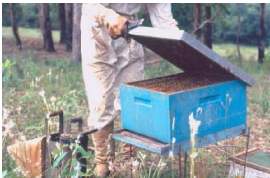
Figura 8. Revisão e limpeza de colméias no início da safra: procedimento fundamental para garantir boa colheita.

Planejar o trabalho antes de ir a campo. Conferir se todo o material está indo para o apiário. Identificar suas colméias e usar fichas ou caderneta de controle.