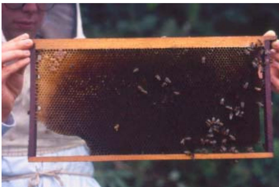
Figura 13. Favo velho, com cera escurecida e alvéolos reduzidos em diâmetro, após sucessivas gerações de cria em seu interior: deve ser substituído.

Conseqüentemente, as abelhas de ambos os enxames irão roer o papel vagorosamente. Nesse processo, os feromônios dos enxames começarão a se mesclar. As rainhas irão brigar até a morte de uma delas, passando a vitoriosa a atuar sobre as duas populações.