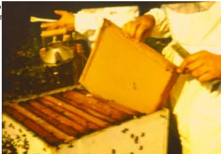
Figura 11. Limpeza do ninho e troca de quadros com favo velho por quadros com lâminas inteiras de cera alveolada.

Os quadros com cera alveolada não deverão ser colocados inicialmente no centro da área de crias do enxame, mas sim nas bordas da mesma, após os favos com cria mais externos do ninho, para não dividir a esfera de crias.