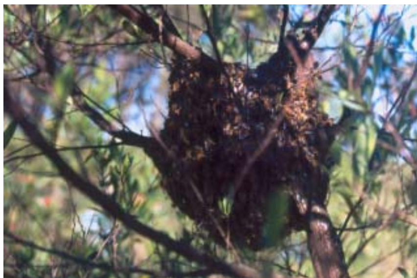
Figura 7. Enxame temporariamente pousado em galho de árvore, durante deslocamento enxameatório ou migratório.

b) colocar sobre o ninho uma melgueira vazia para que as abelhas, ao serem derrubadas para dentro do ninho, não caiam para fora pelas laterais;