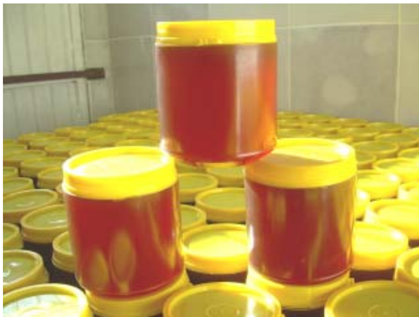
Figura 17. Mel processado e embalado para comercialização direta ao consumidor.