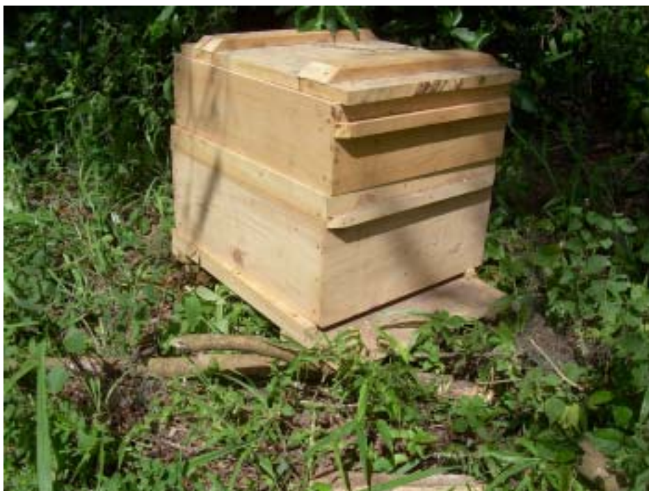
Figura 2. colméia Langstroth padrão, com fundo, ninho, melgueira e tampa.

O modelo de colméia mais utilizado no Brasil é o Langstroth (caixa "americana") ( Figura 2 ) que, pela padronização, além de favorecer a troca de materiais e de relatos sobre as práticas e procedimentos entre os apicultores, facilita o próprio manejo das colméias pelos apicultores, em função das dimensões dos quadros e peças da caixa e de certos detalhes construtivos da mesma ( Quadro 1 ).