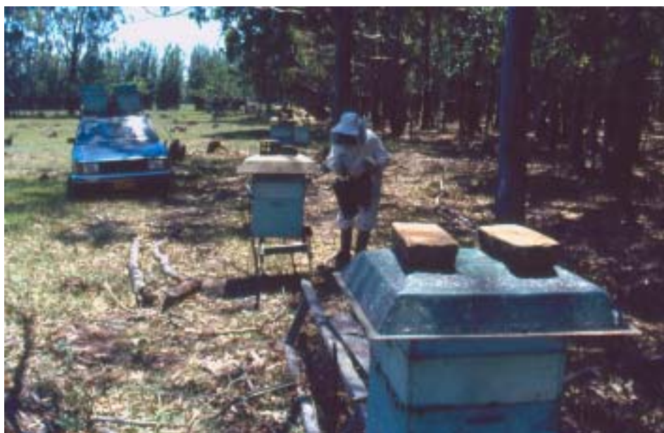
Figura 4. Apiário bem localizado e colméias instaladas individualmente sobre cavaletes.

Deve ser mantida uma distância de 1 a 3 metros entre as colméias para evitar pilhagem entre enxames. Distâncias menores confundem as abelhas campeiras e estressam as abelhas guardiãs. Distâncias maiores reduzem a eficiência e agilidade no trabalho dos apicultores ( Figura 4 ).