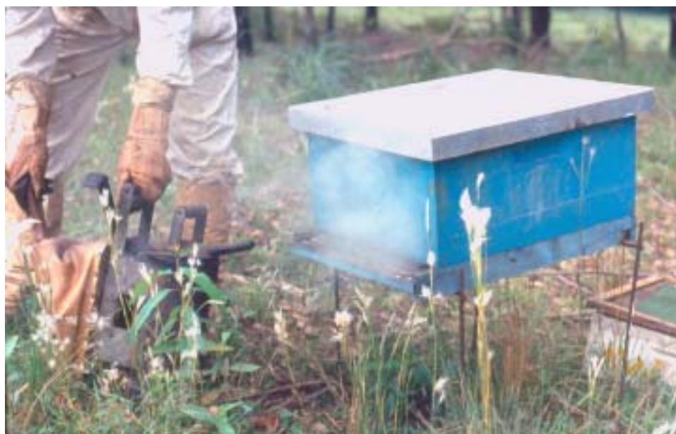
Figura 3. Apicultor aplicando fumaça no alvado com o fumegador, garantindo o manejo seguro e adequado das colméias.

Alguns apicultores substituem o formão por um facão. O mesmo acaba servindo para limpar as ervas de maior porte ao redor das colméias e os galhos pelo caminho de acesso ao apiário.