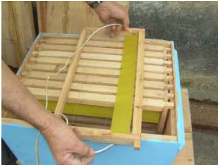
Figura 5. Preparo de caixas-isca, com incrustação de tiras de cera alveolada, para atrair enxameações.

a) preparar caixas de papelão ou de madeira que comportem 5 quadros de ninho providos de cera laminada com a largura do quadro, mas a altura de apenas 3 centímetros. ( Figura 5 ). As colméias padrão, de madeira e com 10 quadros, também poderão ser utilizadas para