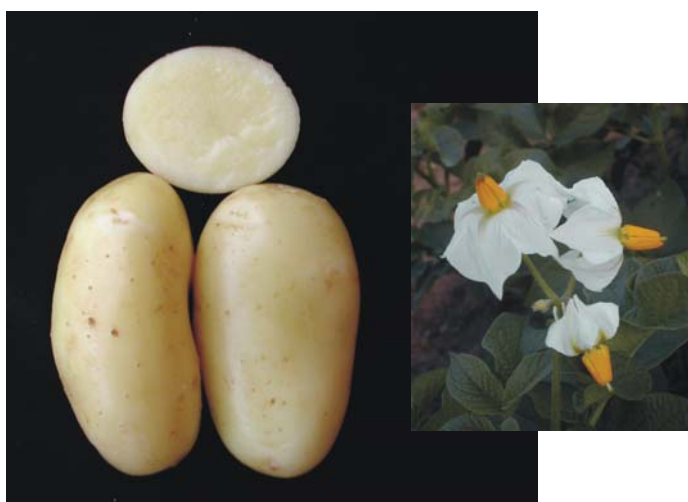
Figura 2. Flor e tubérculos da cultivar Cristal.

áspera; olhos rasos; polpa amarela intensa; broto cilíndrico largo com ápice medianamente fechado, base com pouca pubescência e coloração vermelho púrpura de intensidade de médio a forte; primórdios radiculares de intensidade baixa a média e brotação lateral curta; dormência média, com dominância apical; sensibilidade mediana ao esverdeamento.