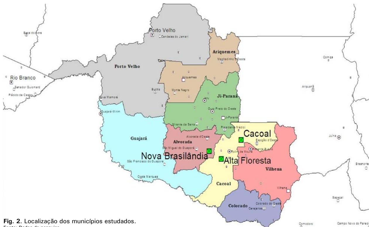
Fig. 2. Localização dos municípios estudados. Fonte: Dados da pesquisa.

estado. Foram escolhidos a cafeicultura irrigada em Cacoal, a cafeicultura clonal em Nova Brasilândia e o sistema melhorado por poda e adubação em Alta Floresta (Fig. 2).