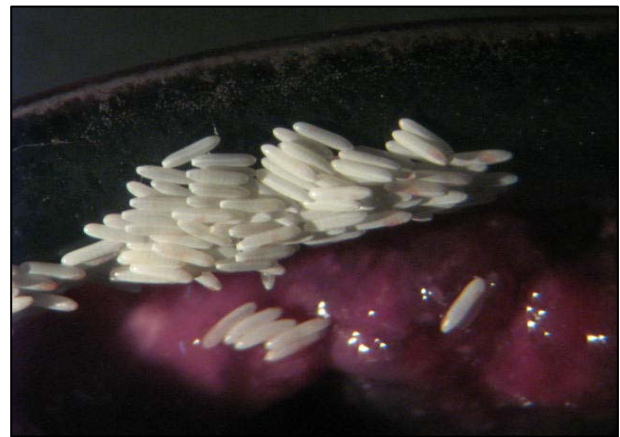
Fig. 2. Postura de ovos realizada por Cochliomyia hominivorax "in vitro".

2.800 ovos depositados durante a fase adulta (Fig. 2). O período de incubação dos ovos varia entre 11 e 21 horas. Após a eclosão dos ovos (Fig. 3) as larvas penetram no tecido e iniciam o período parasitário. Em laboratório o período de L 1 e L 2 é de cerca de 24 horas, e de L 3 entre quatro e cinco dias. Em infestações naturais essas larvas alimentam-se do tecido do hospedeiro, conservando seus espiráculos respiratórios voltados para o exterior. O desenvolvimento de todos os estágios larvais se dá entre 4 e 8 dias, quando as larvas se desprendem do hospedeiro para a pupação. O período de pupa varia de acordo com as condições ambientais (principalmente temperatura e umidade). Em condições favoráveis (normalmente na época de temperatura mais elevada), o período de pupa ocorre em cerca de sete dias, enquanto que nas épocas mais frias este período pode se estender por até dois meses. As fêmeas copulam uma única vez durante sua vida, iniciando seu período de postura, com cerca de dez dias após terem emergido do pupário (OLIVEIRA-SEQUEIRA; AMARANTE, 2002).