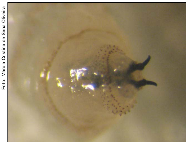
Fig. 1. Ganchos orais presentes na extremidade anterior da larva de Cochliomyia hominivorax .

As moscas C. hominivorax só realizam a postura nos bordos de ferimentos de mamíferos de sangue quente. As larvas, com ajuda das enzimas proteolíticas contidas na saliva, alimentam-se de fluídos corporais e de tecido muscular do hospedeiro, onde se estabelecem através de seus ganchos orais (Fig. 1). Estas lesões liberam um odor desagradável, que serve para atrair mais moscas, que fazem postura de mais ovos e também moscas de outras espécies como Phaenicia spp., Lucilia spp. e Cochliomyia macellaria , que normalmente se proliferam em carcaças, mas podem crescer em animais vivos, originando miíases cutâneas secundárias (OLIVEIRA et al., 1982).