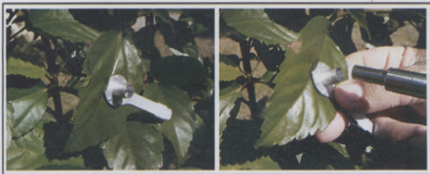
Fig. 3. Clipse de escurecimento preso à folha de hibiscus (esquerda), crescendo em condições de campo, e a fibra óptica (direita) do fluorômetro PAM-2000 (Heinz Walz, Alemanha), sendo introduzida para a medição da fluorescência da clorofila.