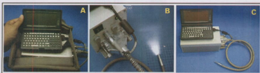
Fig. 2. Fluorômetro PAM-2000, Heinz Walz (Alemanha). A) Conexão do computador palm top ao console pronto para ser ligado. B) Conexão da fibra óptica ao console. Na extremidade da fibra, é possível observar um pulso de saturação de luz aplicado (cerca de 8.000 \mu\text{mol de f\u00f3tons m}^{-2} \text{s}^{-1} ). C) Equipamento montado para a medi\u00e7\u00e3o da fluoresc\u00eancia, sem a bolsa externa de fixa\u00e7\u00e3o ao corpo do operador.

g) Após 20 minutos da colocação do clipe, realizar as leituras da fluorescência utilizando-se fluorômetro de luz modulada modelo PAM-2000 (Heinz Walz, Alemanha, Fig. 2). Ligar o console do PAM-2000 e o computador acoplado ao console. Abrir o programa de gerenciamento (DA-2000) do console. O monitor do computador deve apresentar a "tela de parâmetros" ( parameter screen ). Após a introdução da fibra óptica no clipe (Fig. 3), abrir a janela do clipe e apertar a tecla "M" do computador conectado e esperar aparecer no visor os valores de F_0 , F_m e F_v/F_m (Fig. 4). Proceder da mesma forma para todas as folhas etiquetadas. Para a determinação dos valores de F_v/F_m , pode ser utilizado como alternativa um fluorômetro convencional de luz contínua.