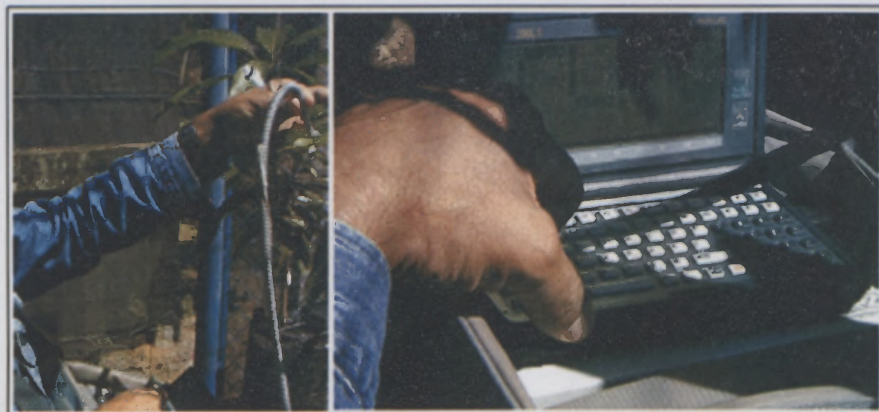
Fig. 4. Medição da fluorescência com o fluorômetro PAM-2000 (Heinz Walz, Alemanha) em mudas envasadas de mangueira (à esquerda) no momento da medição com a fibra óptica acoplada à amostra. A foto à direita ilustra a tela de parâmetros ( parameter screen ), na qual os valores de fluorescência máxima ( F_m ), basal ( F_o ), variável ( F_v calculada como F_m - F_o ) e a razão F_v/F_m poderão ser observados.