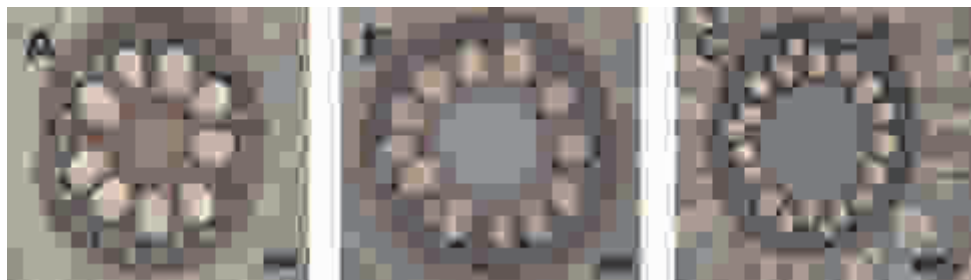
FIGURA 2 - Fotomicrografias de secções transversais radiculares da variedade BR 107 e ciclos 1 e 18 do milho Saracura sob alagamento intermitente. A = BR 107; B = C1; C = C18. A barra corresponde a 100 \mu\text{m}

Um maior número de vasos de xilema com menor diâmetro encontrado nos últimos ciclos de seleção do milho Saracura pode estar relacionado com a garantia de manutenção do fluxo de água. Todavia, em ambientes alagados, por causa da falta de oxigênio, a habilidade das raízes em absorver água é afetada (DELL'AMICO et al., 2001; TOURNAIRE-ROUX et al., 2003).