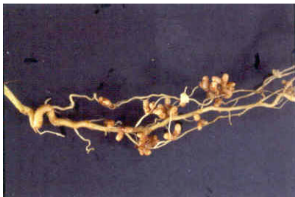
Figura 1 – Nódulos de Chamaecrista

Uma das alternativas seria a utilização de espécies leguminosas fixadoras de nitrogênio (Fig. 1), e associadas à fungos micorrízicos (Fig. 2), que auxiliam as plantas a buscarem água e principalmente o nutriente fósforo, tornando as espécies quase que auto-suficientes nesses elementos para a colonização do local (Fig. 3).