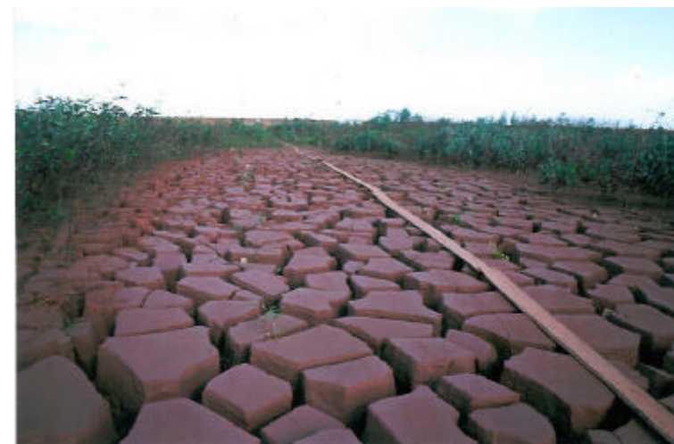
Figura 3 – Vista geral do plantio. Na área central não houve plantio