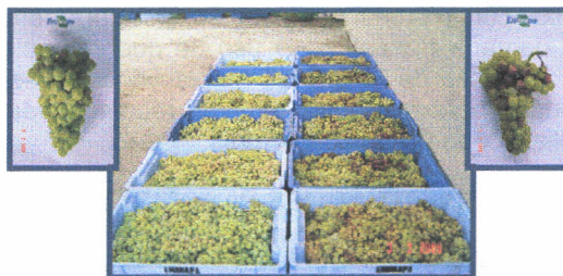
Figura 2. Aspecto visual da uva Moscato Giallo, salientando a diferença no nível de podridão em uvas cultivadas sob plástico (esquerda) e em cultivo convencional (direita).

Em cultivar Moscato Giallo foram observadas reduções na diminuição de incidência de podridões de cacho, atingindo em média 64,35%. Nesta redução de incidência de doenças se destacou principalmente a glomerela (-76,55%) e a podridão ácida (-77,11%). Quanto a severidade (nº de bagas atacadas por cacho) houveram diminuições de podridão-da-uva-madura (-89,47%), podridão-cinzenta-da-uva (-57,56%) e podridão ácida (-84,54%).