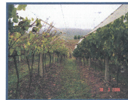
Figura 3. Prolongamento do período de enfolhamento de videiras sob cobertura plástica (média +30 dias em M. Giallo).

Destaca-se que as folhas no cultivo protegido podem permanecer biologicamente ativas por um período superior, comparativamente as plantas do cultivo convencional. Sendo que a queda das folhas das plantas cobertas ocorre somente devido a senescência, e sem a interferência de agentes externos. Em contrapartida, no cultivo convencional a queda das folhas é precoce e possivelmente relacionada ao ataque de doenças fúngicas ou à respostas de fitotoxidez aos agrotóxicos aplicados.