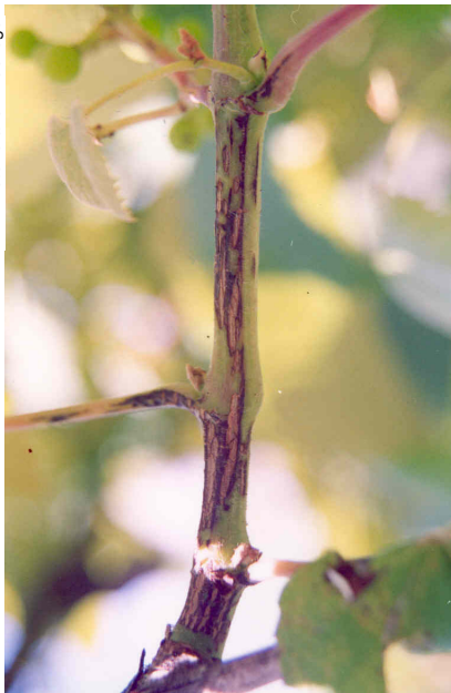
Fig. 3. Escoriações na base do ramo causada por escoriose.

Os sintomas da escoriose podem às vezes ser confundidos com os da antracnose tanto nos ramos, como nas folhas, entretanto algumas diferenças podem ser observadas: as lesões provocadas pela antracnose nos ramos são arredondadas e profundas e nas folhas provocam a perfuração do limbo.