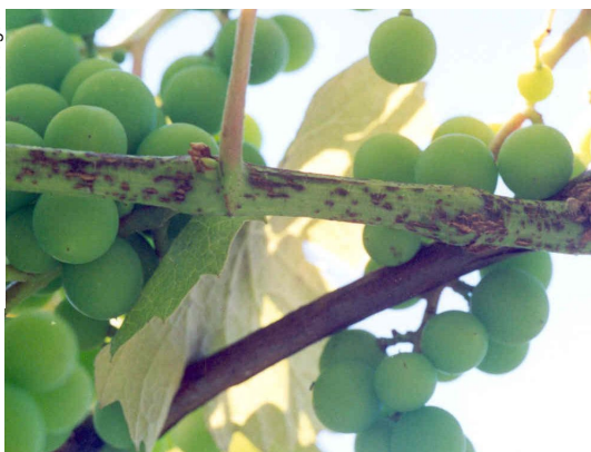
Fig. 4. Lesões de escoriose no ramo de uva americana.

Durante a primavera, aparecem no engaço manchas similares àquelas sobre os brotos e as folhas. Nos frutos, os sintomas são geralmente pouco expressivos. Apenas alguns cachos são afetados, apresentando, nas bagas, picnídios freqüentemente dispostos em