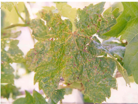
Fig. 2. Deformação da folha causada por escoriose.

morte das gemas basais, dificultando a poda e reduzindo a brotação. Patologicamente, as lesões nos brotos tornam-se inativas durante o verão (UNIVERSITY OF CALIFORNIA, 1982).