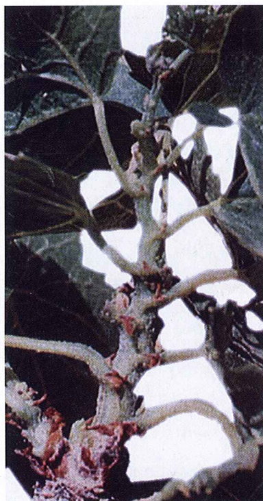
Fig. 1. Ramo com entrenós curtos.