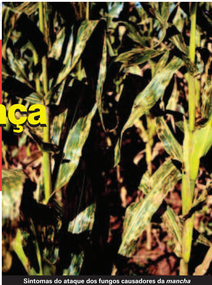
Sintomas do ataque dos fungos causadores da mancha

A utilização de cultivares resistentes é a medida de controle mais eficiente