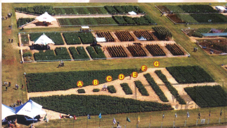
Variedades em exposição no Campo Experimental CVALE