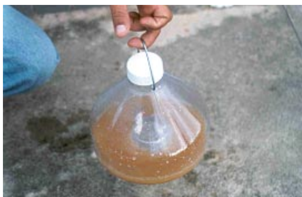
Fig. 5. Fechamento e limpeza da armadilha McPhail após a colocação da solução atrativa.

Identificar a armadilha colocando seu número e o código da propriedade, na tampa com caneta para retroprojeter (resistente à água). Tampar a armadilha e limpar sua superfície externa, evitando resíduos do atrativo na parte externa (Fig. 5), pois isso pode reduzir a eficiência de captura da armadilha, uma vez que as moscas atraídas se alimentarão por fora da armadilha. No comércio existem potes contendo 500 mL do hidrolizado (Fig. 1), que em solução, fornecerão dez litros de atrativo, suficientes para abastecer 15 armadilhas.