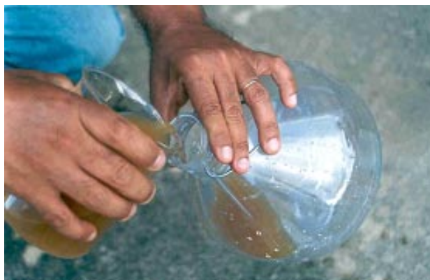
Fig. 4. Colocação da solução atrativa na armadilha.

ela fique homogênea. Após a preparação da solução, remover a tampa da armadilha e acrescentar o atrativo até o nível de 400 mL, tendo-se o cuidado de não derramá-lo (Fig. 4).