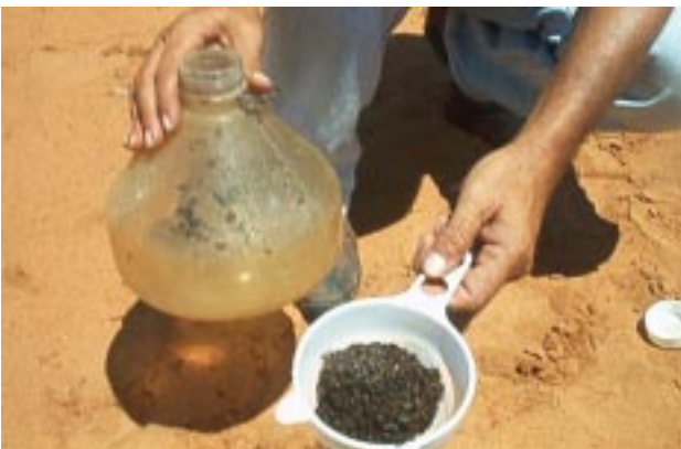
Fig. 9. Retirada dos insetos capturados nas armadilhas McPhail.

Esses insetos devem ser colocados cuidadosamente em recipientes plásticos transparentes, com capacidade para 250 mL. Deve ser utilizado álcool a 70%, como conservante, identificando-se cada frasco com etiquetas, onde constem o código e número da armadilha, local e data de coleta, (Fig. 10).