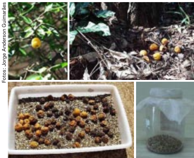
Fig. 14. Coleta e acondicionamento de frutos para a emergência de adultos de moscas-das-frutas.

Uma parte dos frutos coletados pode ser acondicionada em bandejas plásticas, contendo uma base de areia ou serragem esterilizada para dar condições de empupação do inseto (Fig. 14) ou em mesas coletoras de pupas. As pupas, coletadas diariamente, deverão ser acondicionadas em recipientes de vidro transparente cobertos com tecido de filó fino, contendo no seu interior, uma camada de vermiculita (Fig. 14), à espera da emergência dos adultos.