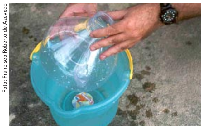
Fig. 3. Lavagem da armadilha McPhail.

Antes de usar a armadilha McPhail deve-se lavá-la bem, por dentro e por fora, usando água limpa. Não usar sabão ou qualquer outro produto químico, pois isso pode afetar a eficiência de atração dos adultos das moscas-das-frutas (Fig. 3).