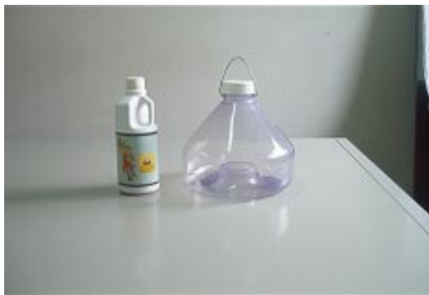
Fig. 1. Proteína hidrolizada de milho e aspecto geral de uma armadilha do tipo McPhail para capturar adultos de moscas-das-frutas.

A captura se baseia no fato de que a mosca é atraída pelo odor da proteína e ao entrar na armadilha cai no líquido e morre. O líquido atraente pode conter inseticida para acelerar a morte da mosca. O atrativo tem um raio de atração de 50 metros, capturando adultos de ambos os sexos de Anastrepha spp. e Ceratitis capitata , principais espécies de moscas-das-frutas presentes no Brasil.