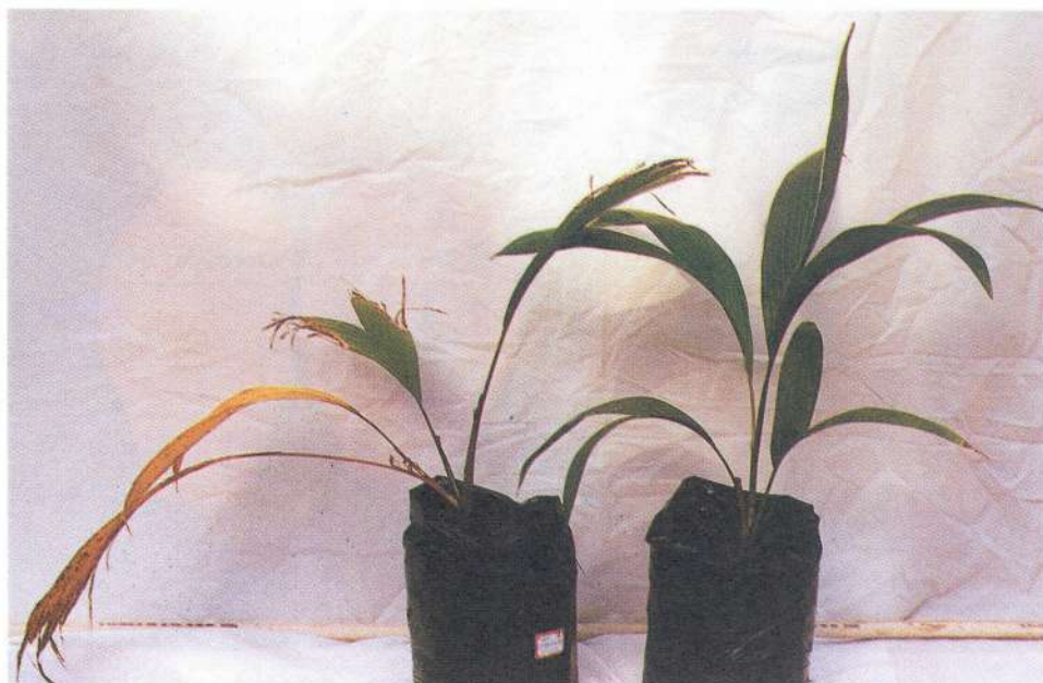
Fig. 11.5 Mudras de pupunheira sem espinho, com sintomas de podridão da base do estipe causada por Phytophthora palmivora (à esquerda), e muda sadia (à direita).

em pupunheira, frutos de mamoeiro ( Carica papaya , L.) e cacauzeiro ( Theobroma cacao L.) foram inoculados sob condições de laboratório com discos de cultura do patógeno isolado da pupunheira. A reprodução de lesões típicas de podridão provocadas por P. palmivora nesses hospedeiros, foi observada sete dias após a inoculação (Fig. 11.6).