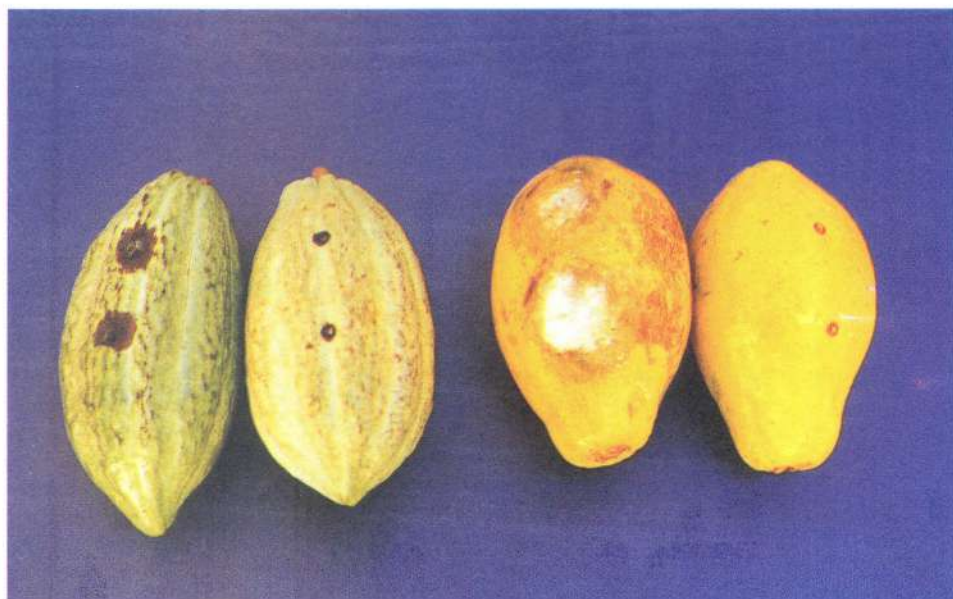
Fig. 11.6 Sintomas de podridão em frutos de cacaueiro (à esquerda) e de mamoeiro (à direita), resultantes da inoculação artificial de Phytophthora palmivora , isolado da pupunheira, em comparação com frutos inoculados apenas com blocos de ágar-água (Testemunha).