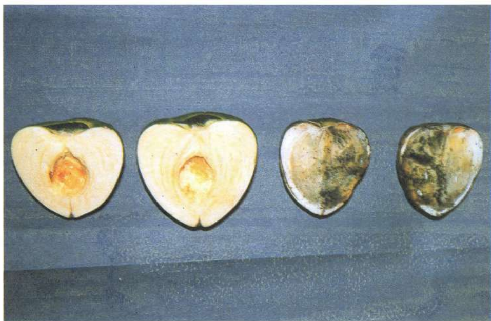
Fig. 11.2 Frutos de pupunheira com sintomas de podridão negra, causados por Thielaviopsis paradoxa . (à direita) em comparação com frutos sadios.

Os sintomas iniciais aparecem sob a forma de lesões circulares com coloração amarelada, translúcidas que são visíveis em as ambas faces das folhas. As lesões de 7 mm a 8 mm de comprimento apresentam a forma elíptica, tornando-se gradualmente de cor marrom brilhante para marrom escuro. No centro, a lesão apresenta uma depressão sendo contornada por um halo amarelado (Fig. 11.3). Quando a infecção é severa, as lesões coalescem, provocando o secamento das extremidades das folhas.