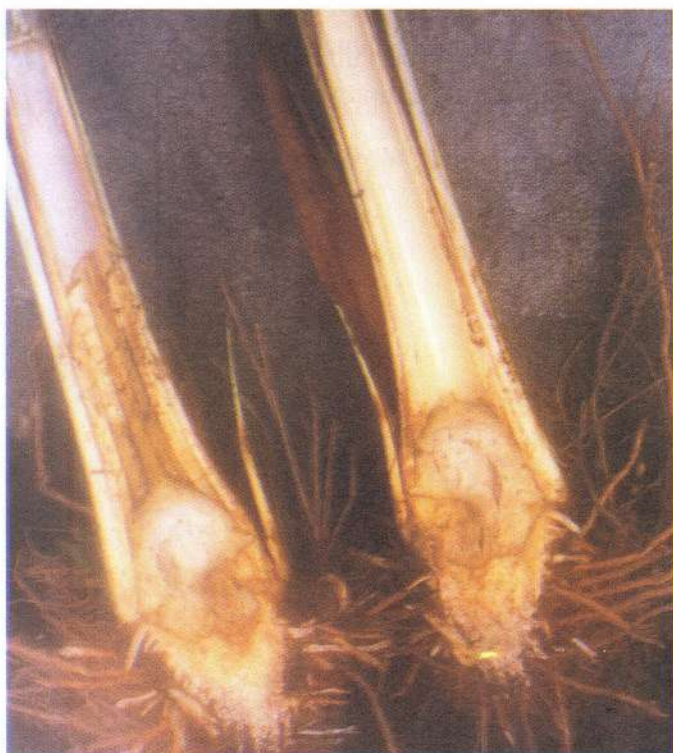
Fig. 11.4 Corte longitudinal do estipe de pupunheira sem espinhos, com sintomas de podridão da base do estipe ( Phytophthora palmivora ).

A doença é causada pelo fungo Phytophthora palmivora (Butl.)Butl., um Oomiceto da ordem Peronosporales , família Pythiaceae . Produz zoosporângios em forma de limão com pedicelo curto. Em testes de patogenicidade, em mudas sadias de pupunheira, os sintomas detectados