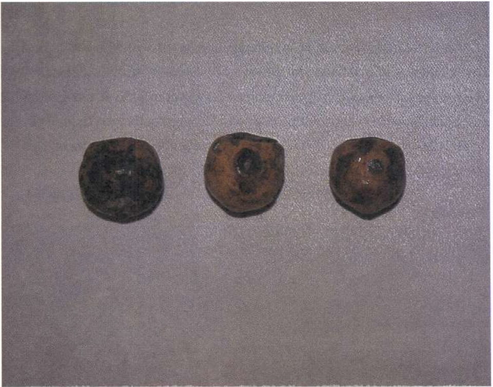
Fig. 11.1 Frutos de pupunheira com sintomas de antracnose, causados por Colletotrichum gloeosporioides .