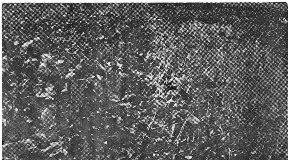
Foto n.º 2 — Vista parcial do experimento. A direita “competição de variedades”. Nota-se a variedade “40 dias” em época de colheita.