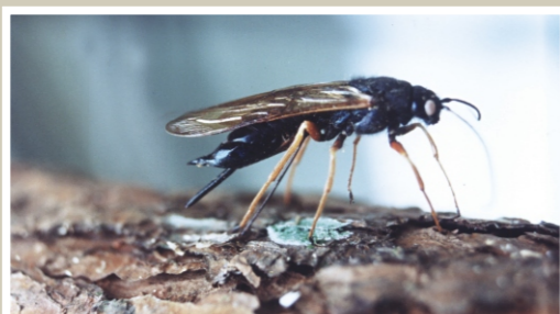
Vespa-da-madeira ( Sirex noctilio )

A alternativa mais viável é a amostragem sequencial, pois a amostra é dimensionada no campo, em função dos níveis de ataque, de forma a não ocorrer falta de precisão com tamanhos reduzidos e nem desperdícios com tamanhos excessivos da amostra.