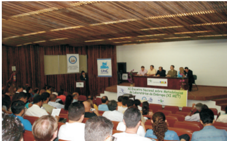
Fig. 1. Abertura do evento.