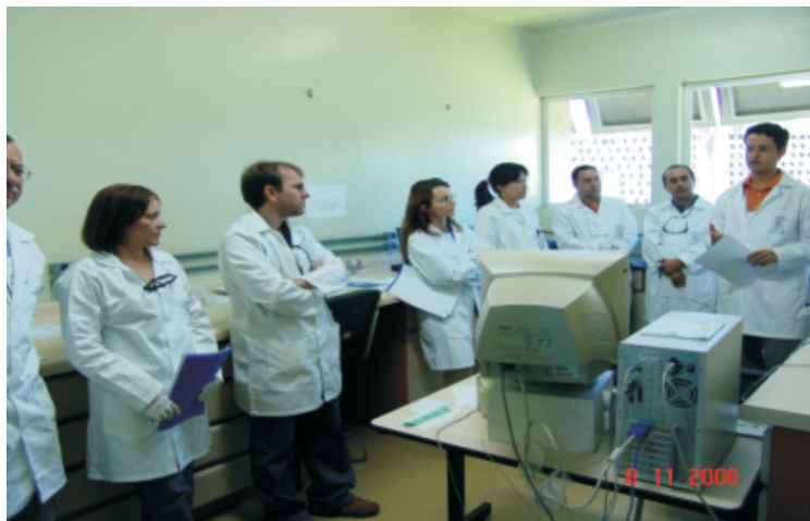
Fig. 3. Mini-curso de biologia molecular básica.