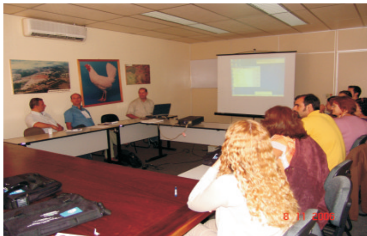
Fig. 2. Grupo de trabalhos sobre tratamento de resíduos.