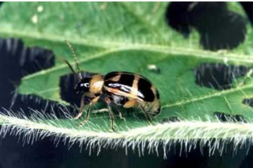
Fig. 2. Adultos de Cerotoma arcuatus .