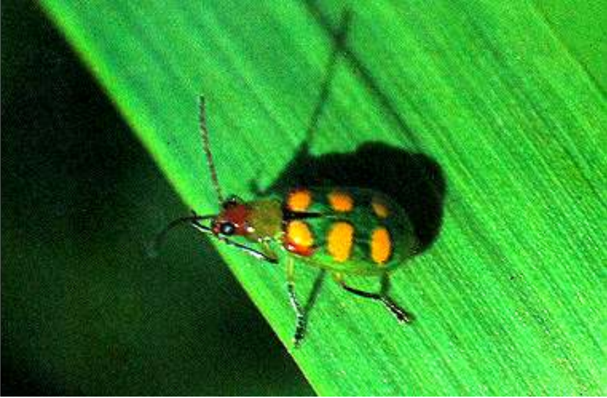
Fig. 1. Adultos de Diabrotica speciosa .