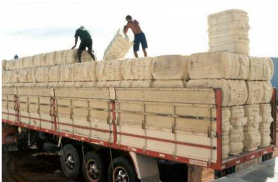
Fig. 9. Carregamento e transporte de fardos de algodão beneficiado (pluma).