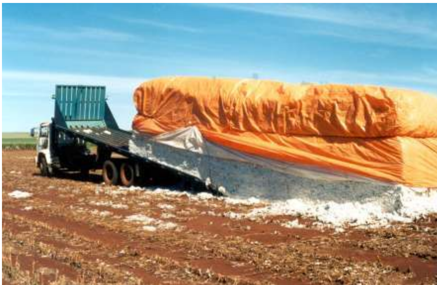
Fig. 4. Carregamento de "tijolões" de algodão em caroço, na lavoura.