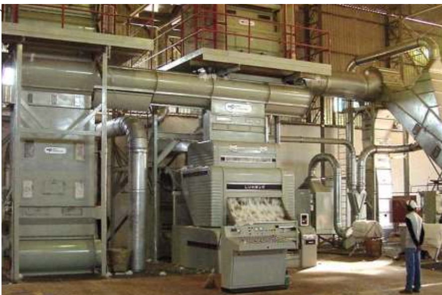
Fig. 7. Máquina de beneficiamento (limpeza e descarçamento).