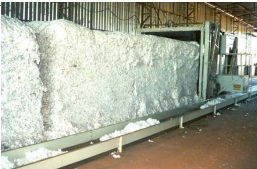
Fig. 6. Máquina descompactando “tijolão” para início do beneficiamento.