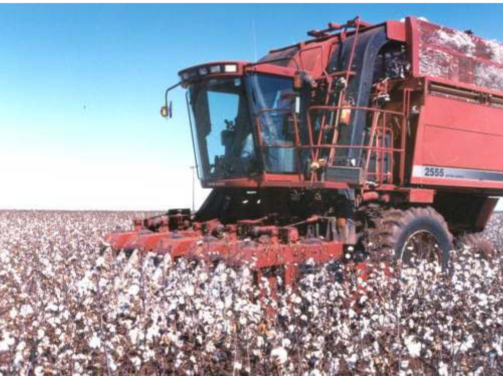
Fig. 3. Colheita mecânica de lavoura de alta tecnologia.

Os produtores realizam o transporte do algodão em caroço até a Cooperativa Agropecuária Sulmatogrossense - AGROCOOP, em Maracaju, MS, para o beneficiamento - descaroçamento, limpeza e enfardamento (Fig. 6 e 7). A algodoeira compra o algodão em pluma dos produtores e o envia para a matriz na cidade de Naviraí, MS, que faz a comercialização do produto.