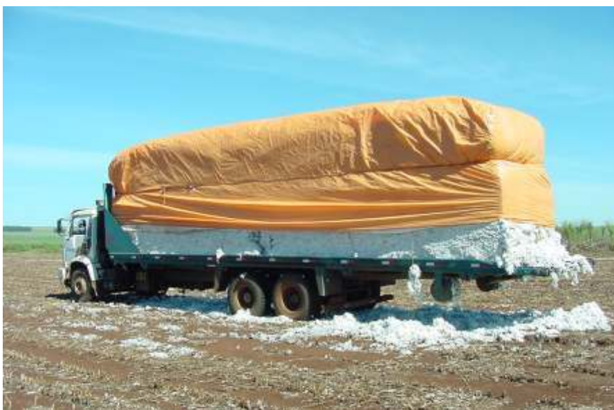
Fig. 5. Transporte de "tijolões" de algodão em caroço.