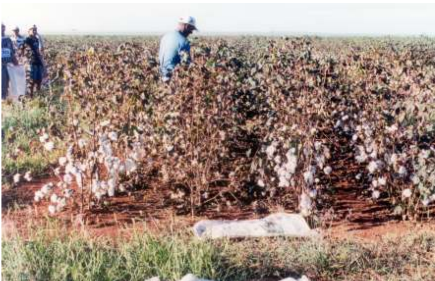
Fig. 8. Colheita manual de lavoura de baixa tecnologia.