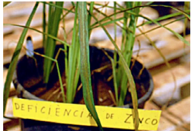
Fig. 1. Foto mostrando os sintomas de deficiência de Zn em plantas de arroz de terras altas.

nessa cultura (BARBOSA FILHO, 1987), e é a única que se recomenda controlar rotineiramente pela adubação. A deficiência, tipicamente, resulta em manchas longitudinais cor de ferrugem nas folhas mais velhas (Fig. 1), aproximadamente aos 30 dias após emergência e os principais efeitos, são o encurtamento dos internódios e a redução do crescimento das plantas.