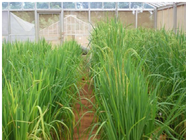
Fig. 2. Plantas de arroz de terras altas à esquerda crescendo em solo trabalhado e cultivado por mais de 20 anos com culturas anuais, e em solo virgem à direita.

(2) Dentro da coluna, médias seguidas pela mesma letra não diferem, significativamente, ao nível de 5% de probabilidade, pelo teste de Scott-Knott. Letras maiúsculas correspondem a comparação entre solos e minúsculas entre tratamentos de suplementação foliar de micronutrientes.