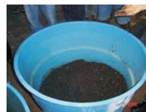
Fig. 1. Esterco colocado no recipiente para preparo do biofertilizante Vairo.