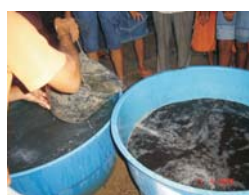
Figs. 2 e 3. Adição da água no preparo do biofertilizante Vairo e apresentação de borbulhamento após a mistura