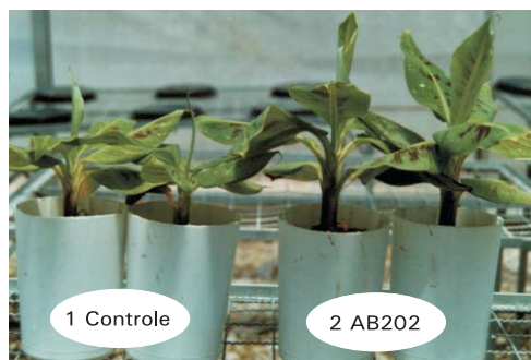
Fig. 1. Vigor de mudas micropropagadas da bananeira cv. Grande Naine submetidas à inoculação e não com isolado de bactéria relacionada a Burkholderia cepacia AB202, aos quatro meses e meio de cultivo em vasos com areia e vermiculita (2:1, v/v) na casa de vegetação da Embrapa Agroindústria Tropical, em Fortaleza, Ceará.

Weber (1998) cultivando mudas em vasos durante quatro meses obteve incrementos de até 15,8% na massa seca de mudas da cultivar Butuhan e até 31,2% na cultivar Prata Anã, quando da inoculação com o isolado de bactérias do tipo Herbaspirillum (BA10) e aumento de 24,6% na massa seca da cultivar Caipira, após sua inoculação com bactéria nominada de Burkholderia brasilensis AB123. O isolado BA126, utilizado na presente pesquisa, forma grupo homogêneo com o isolado BA123 (Weber et al., 1999b).