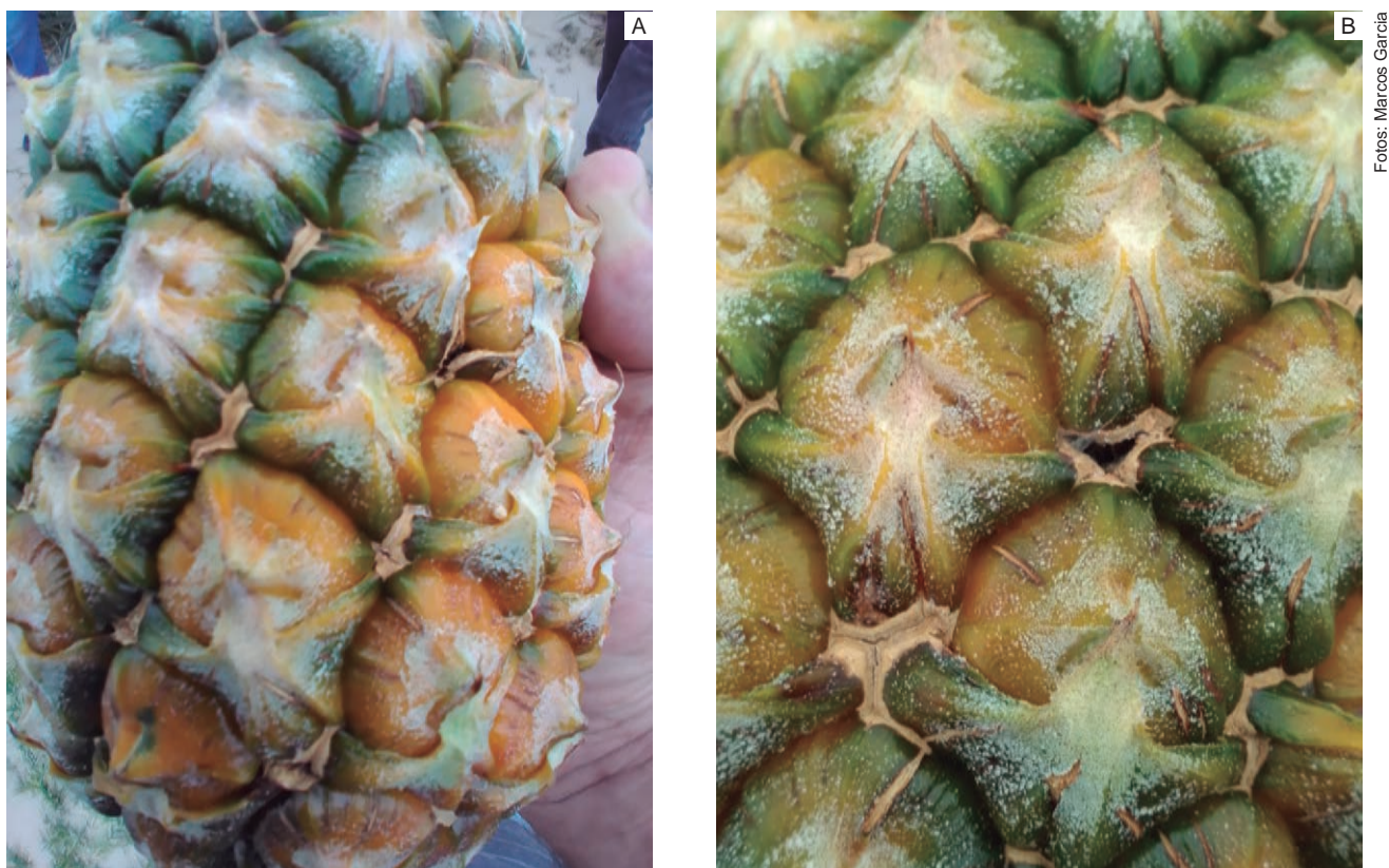
Figura 3.4. Sintomas de deficiência de magnésio em plantas da cultivar Turiaçu Amazonas (A); detalhe do sintoma (B).