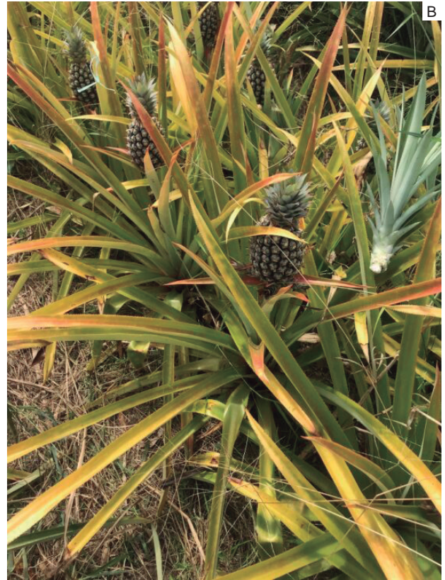
Figura 3.2. Sintomas de deficiência de nitrogênio em plantas da cultivar Turiaçu Amazonas, induzidos em parcela experimental (A); detalhe dos sintomas (B).