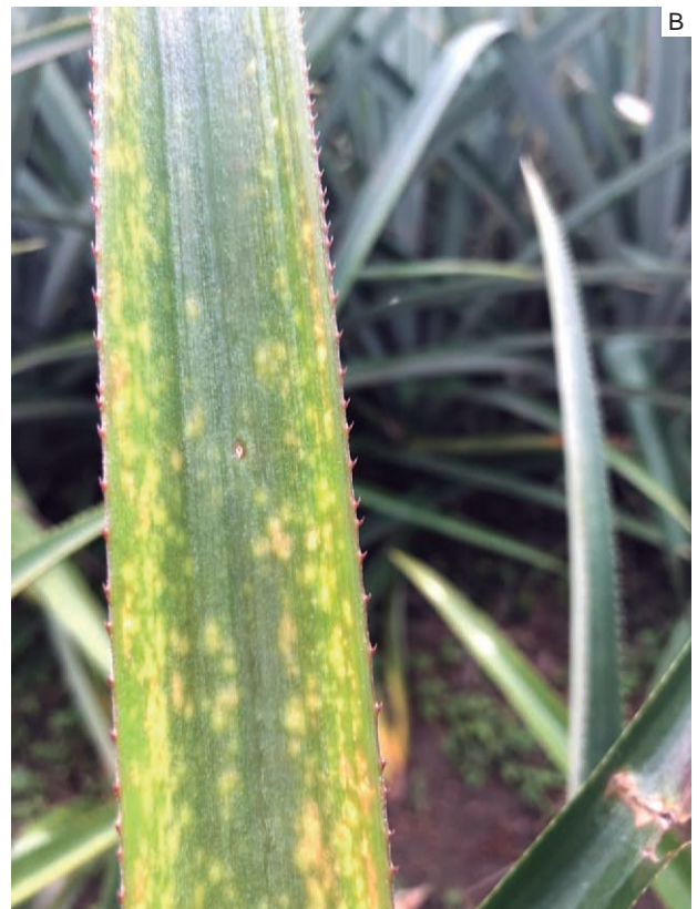
Figura 3.3. Sintomas de deficiência de potássio em plantas da cultivar Turiaçu Amazonas (A); detalhe do sintoma na folha (B).