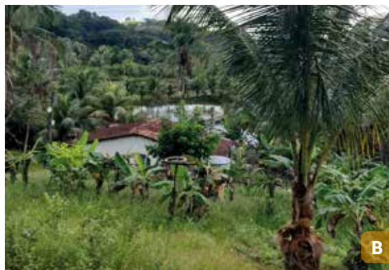
Figura 6. Pescador artesanal (A); área de produção agroecológica do quilombo Engenho Siqueira (B), Rio Formoso, PE.