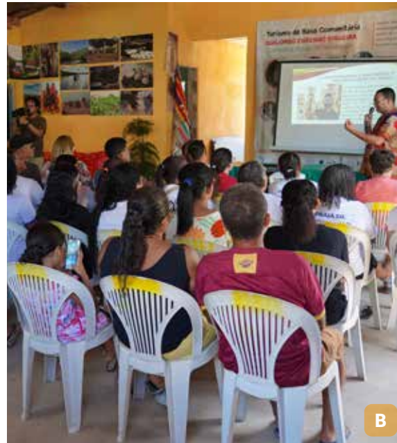
Figura 27. Sede e receptivo da Associação Acqes (A); reunião de trabalho (B).