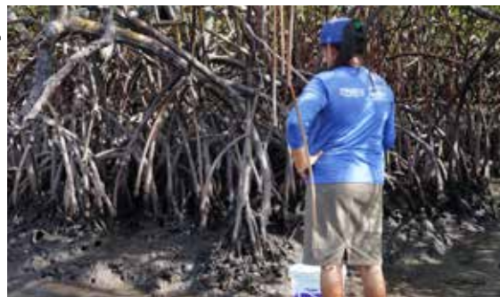
Figura 19. Marisqueira catando aratu.