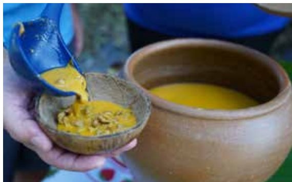
Figura 24. Caldinho de marisquinho feito e servido pelas marisqueiras após a trilha.