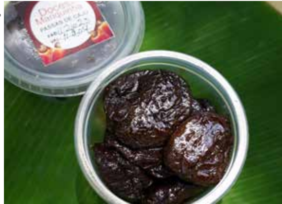
Figura 5. Passa de caju.

queiras, permitindo maior acesso a programas de fomento, linhas de crédito e políticas públicas voltadas para o desenvolvimento da pesca artesanal. A comercialização dos mariscos ocorre em mercados locais, feiras gastronômicas e parcerias com restaurantes, consolidando cadeias curtas de comercialização que valorizam o trabalho das pescadoras e garantem produtos frescos e de qualidade para os consumidores.