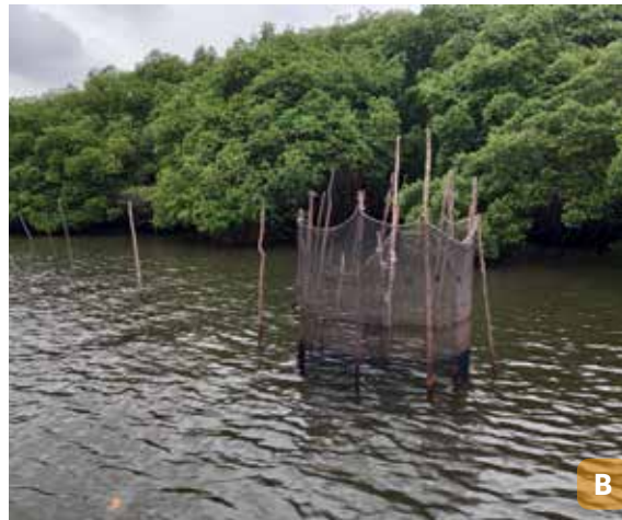
Figura 17. Manguezais da APA de Guadalupe, PE.