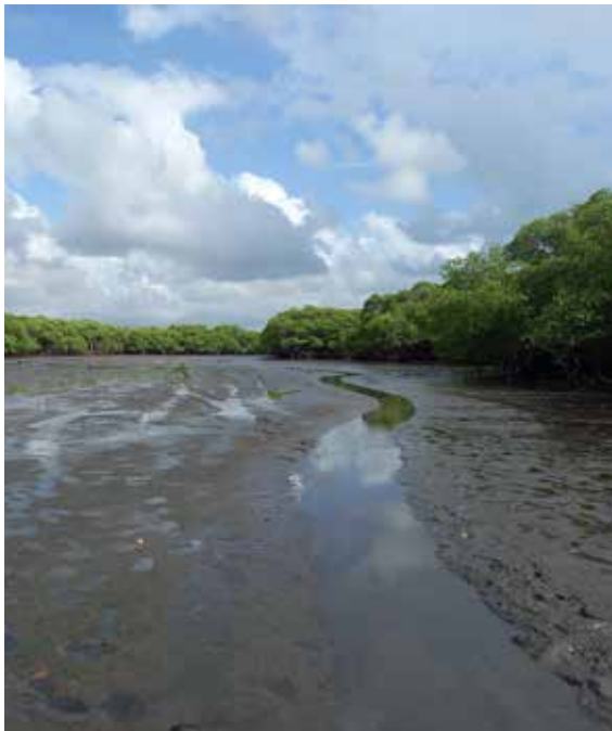
Figura 22. Manguezal onde ocorre a trilha das marisqueiras e contemplação da natureza.