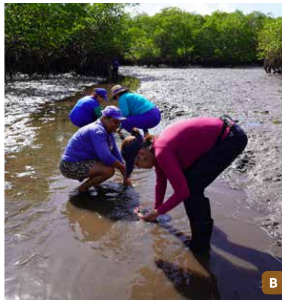
Figura 21. Marisqueira coletando sururu (A); marisqueira catando marisquinho em ação didática aos turistas (B).