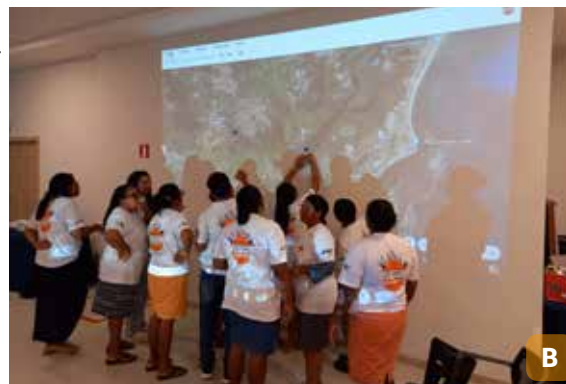
Figura 13. Capacitações para a Amas e a Acqes.