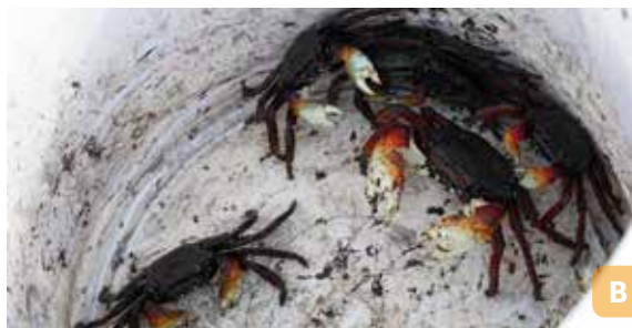
Figura 23. Marisqueira ensinando a catar o aratu (A); aratus coletados (B).