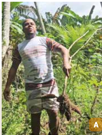
Figura 37. Território do quilombo Engenho Siqueira, Rio Formoso, PE: Rota da Jaqueira (A); contação de histórias sob a jaqueira (B); Pedra da Comadre (C).