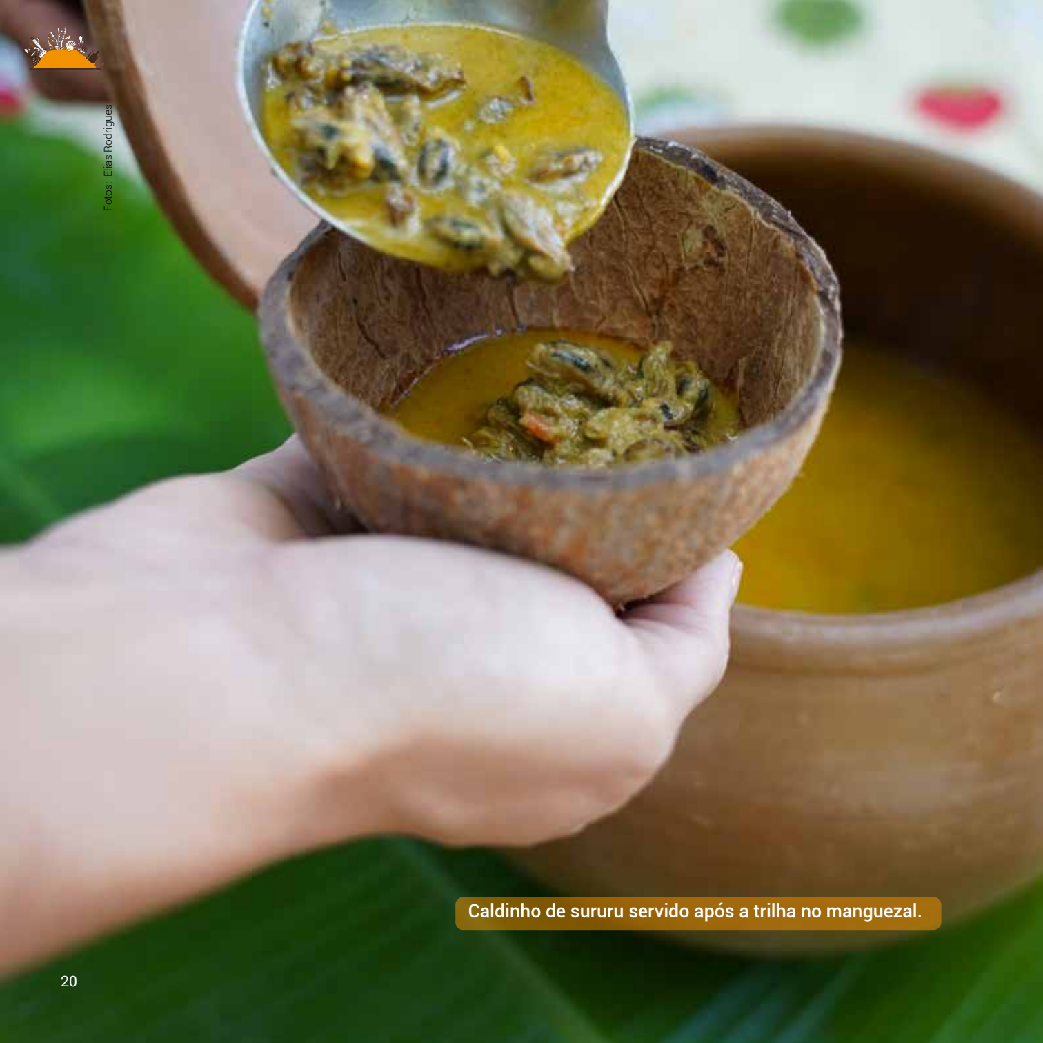
Caldinho de sururu servido após a trilha no manguezal.