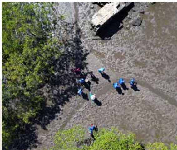
Figura 20. Trilha no manguezal conduzida pelas associadas da Amas.

"Coma o território." O almoço oferecido pelas representantes da Amas possui diversas opções de pratos feitos com frutos do