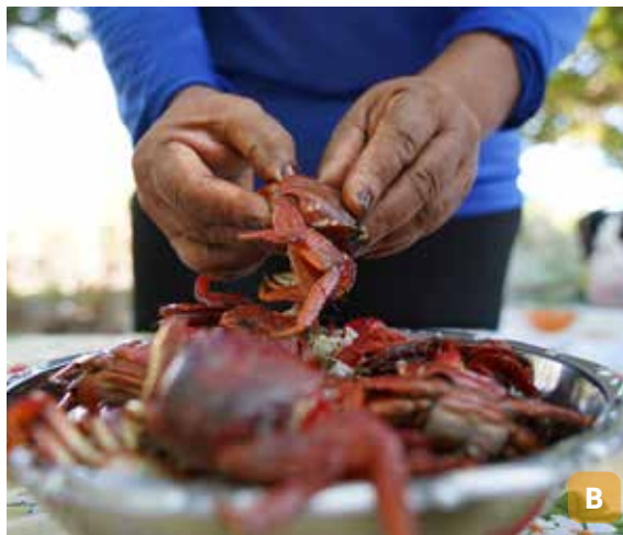
Figura 4. Cata do aratu (A); quebra do aratu para retirada do “filé” (B).