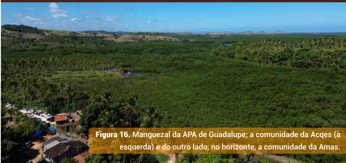
Figura 16. Manguezal da APA de Guadalupe; a comunidade da Acqes (à esquerda) e do outro lado, no horizonte, a comunidade da Amas.