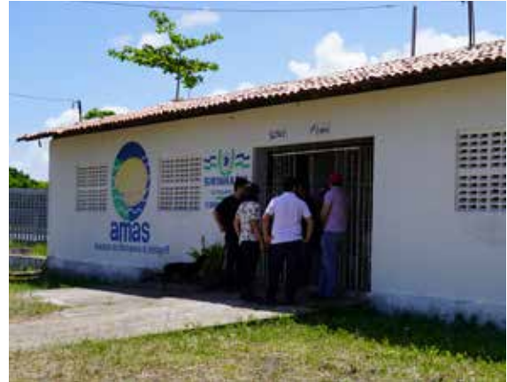
Figura 2. Associação das Marisqueiras de Sirinhaém (Amas), Pernambuco.

Desde que nascem, as marisqueiras vivem o dia a dia da pesca (Figura 3). Geral-