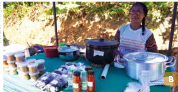
Figura 31. Feira Agroecológica com produtos da Acqes na cidade de Rio Formoso, PE (A); feira nos eventos da Acqes em frente à sede da associação (B).