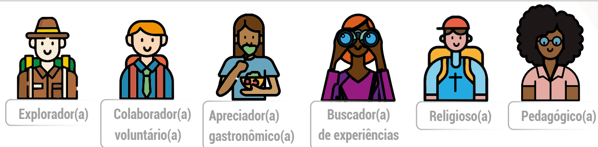
Figura 11. Perfis de turistas potenciais dos territórios.

Considerando a análise da DTA, da oferta e da governança turística dos territórios, desenhou-se uma proposta de perfis de públicos a serem trabalhados pelas comunidades e, a seguir, tem-se identificado cada um destes perfis-alvo (Tabela 2).