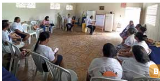
Figura 18. Associação das Marisqueiras de Sirinhaém (Amas) em oficinas, roda de conversas e apresentação da culinária tradicional.