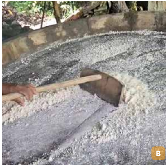
Figura 36. Demonstração do preparo de beijus ao turista (A); casa de farinha (B).