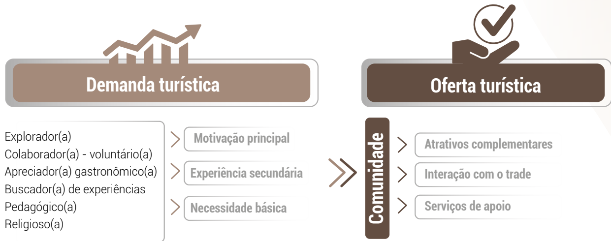
Figura 10 Diagrama da relação entre comunidade, demanda e oferta turística.

pela governança e gestão do destino, relacionado ao formato de viagem que realizam, mercados emissores, comportamentos e preferências.