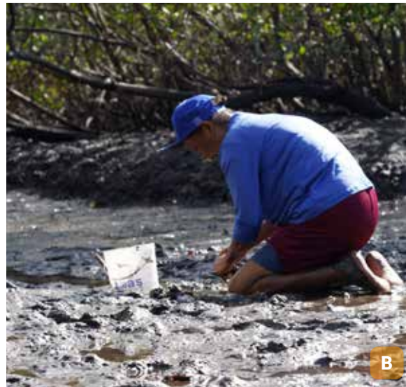
Figura 3. Marisqueira coletando ostra (A); marisqueira coletando sururu (B).