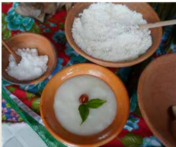
Figura 29. Funji (ou funge) oferecido no restaurante da Acçes — conexão gastronômica com Angola.