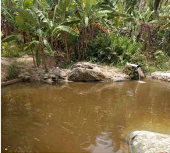
Figura 35. Bica quilombola.