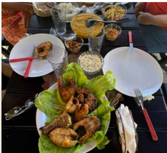
Figura 21. Almoço no restaurante Casa da Mulher.