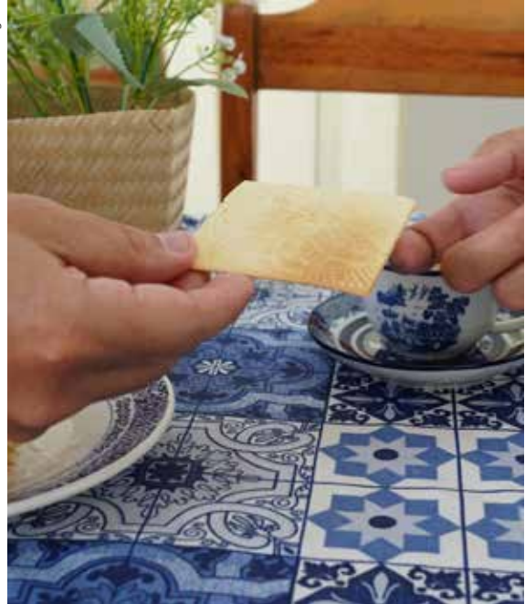
Figura 3. Bricelets , patrimônio imaterial de Sergipe.

regionais e fortalecendo circuitos de comercialização baseados no turismo gastronômico e nas feiras comunitárias.