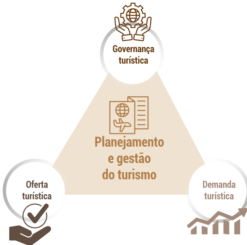
Figura 5. Eixos-base do planejamento e gestão da atividade turística.

Esses três pilares estruturaram as ações de diagnósticos e, posteriormente, das capacitações para embasar a criação de propos-