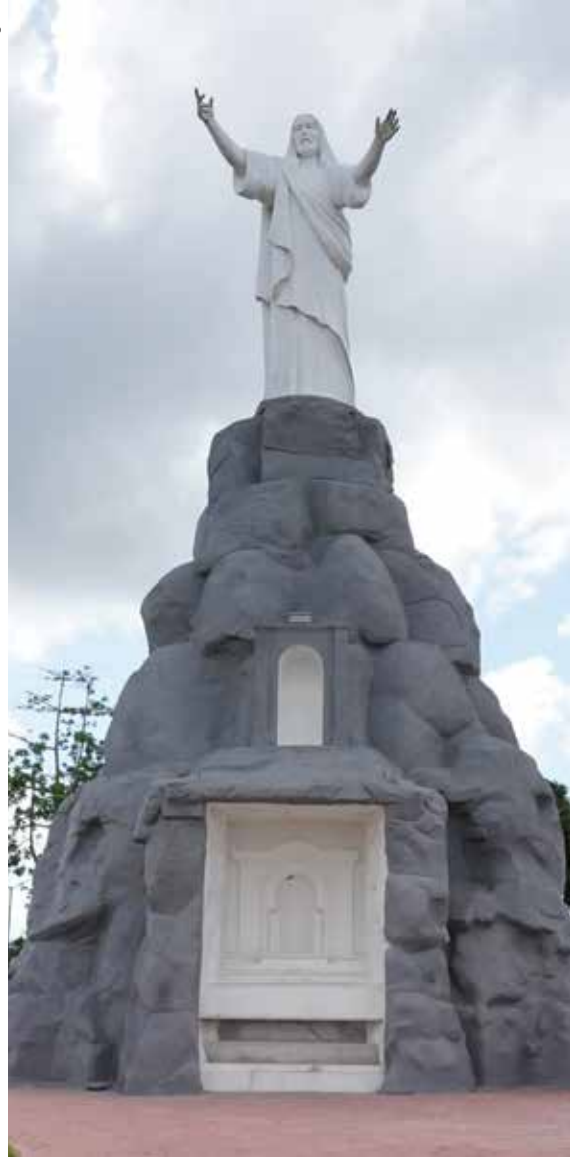
Figura 26. Mirante do Cristo Redentor.