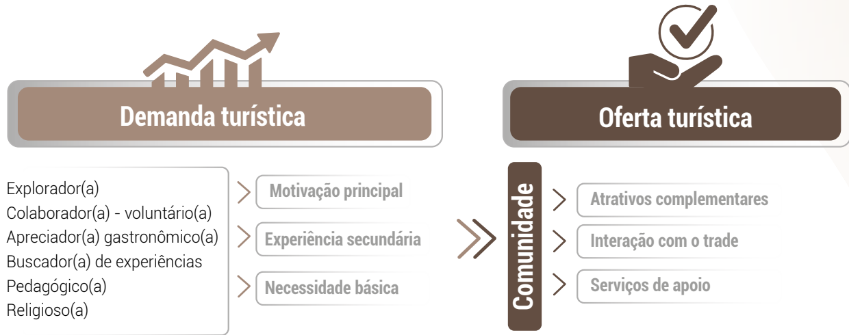
Figura 6. Diagrama da relação entre comunidade, demanda e oferta turística.