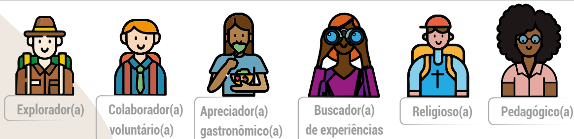
Figura 7. Perfis de turistas potenciais dos territórios.