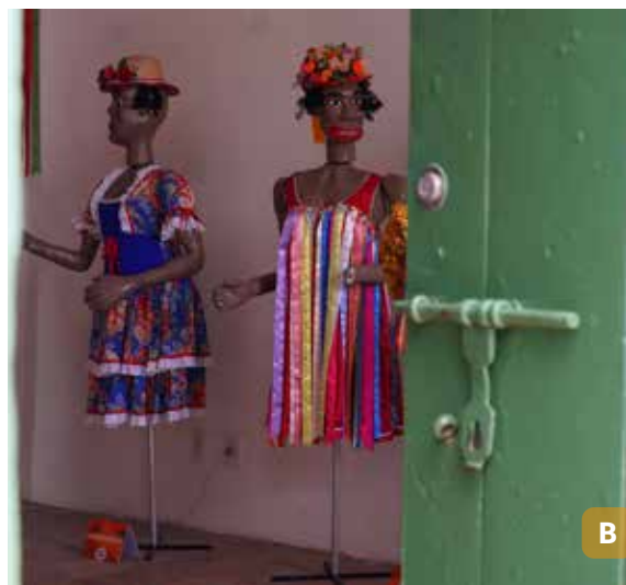
Figura 17. Ruas de São Cristóvão (A); artesanato local (B).