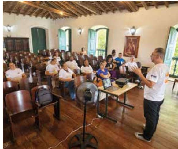
Figura 9. Capacitações em São Cristóvão, SE.