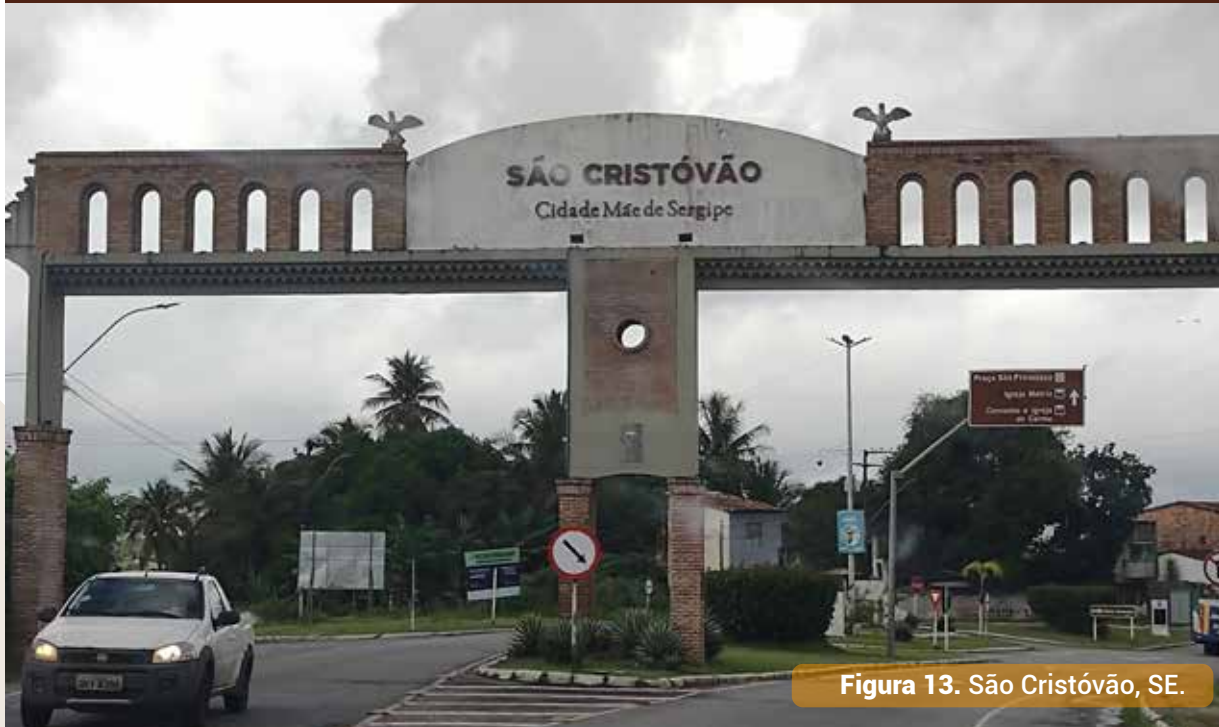
Figura 13. São Cristóvão, SE.