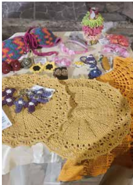
Figura 23. Artesanatos variados de São Cristóvão.