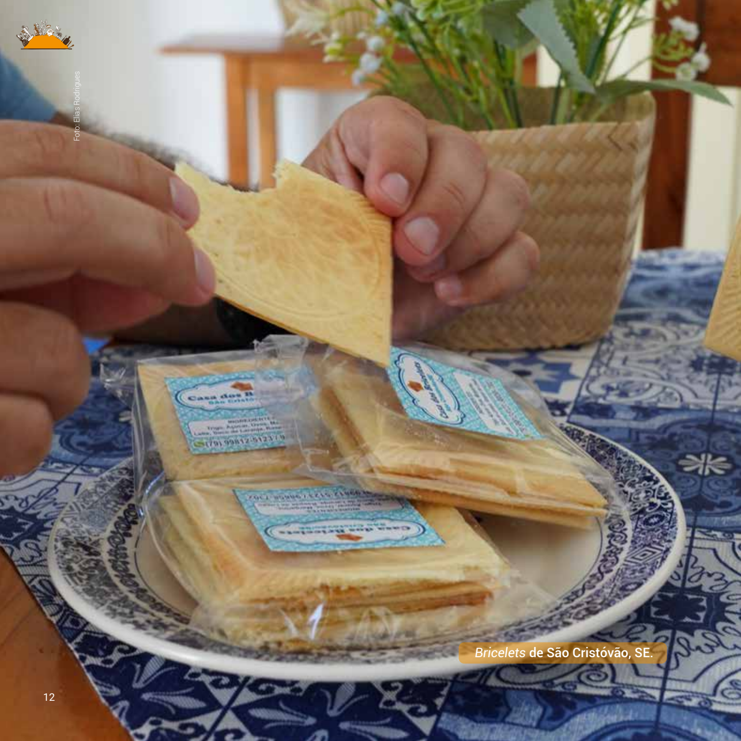
Bricellets de São Cristóvão, SE.