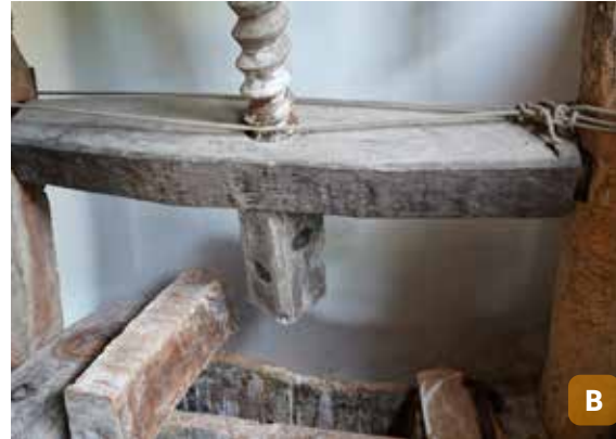
Figura 1. Casa de farinha (A); prensa tradicional (B), em Pedreira, São Cristóvão, SE.

na (Figura 1), da pesca artesanal, da caça de mariscos e da doçaria local, visto que parte das marisqueiras do povoado complementa os seus rendimentos com a produção e venda de beijus, saroiós, pés de moleque, macasados e beijus molhados, além dos doces com representatividade social, como compotas, geleias, doces cristalizados e de corte.