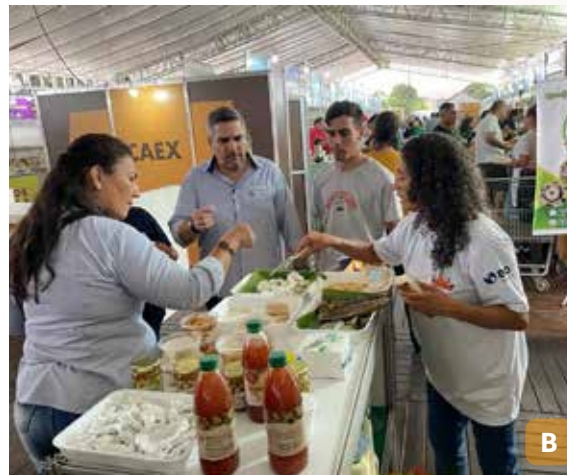
Figura 11. Presença de São Cristóvão na Ruraltur 2023 (A); degustação de beijos e doces de São Cristóvão na Ruraltur 2023 (B).