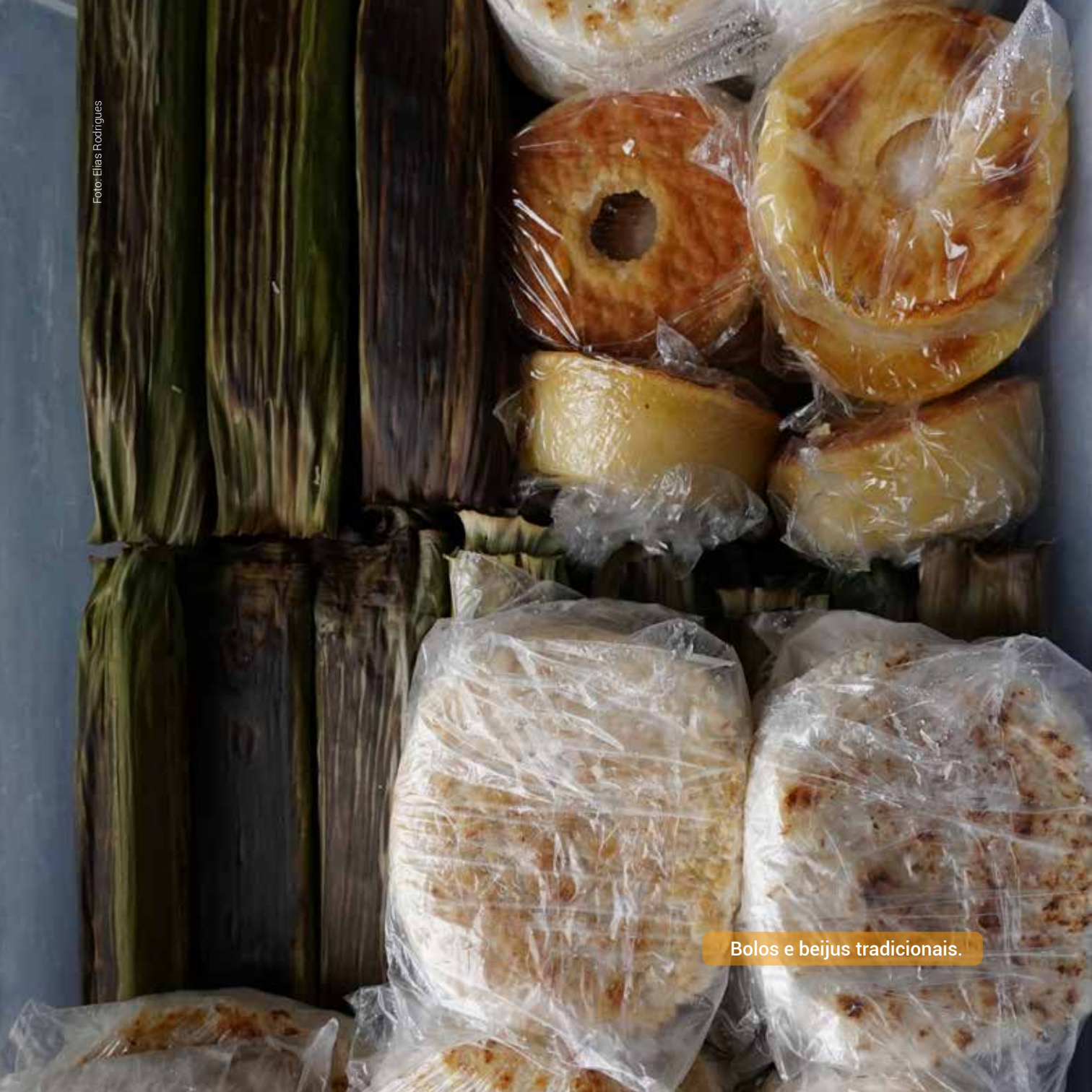
Bolos e beijus tradicionais.