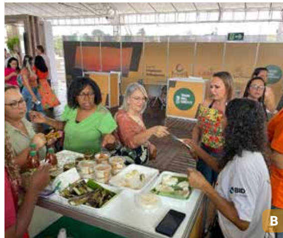
Figura 12. Visitantes no estande da Embrapa na Ruraltur 2023 degustando a variedade de beijos, bolos e bricelets .