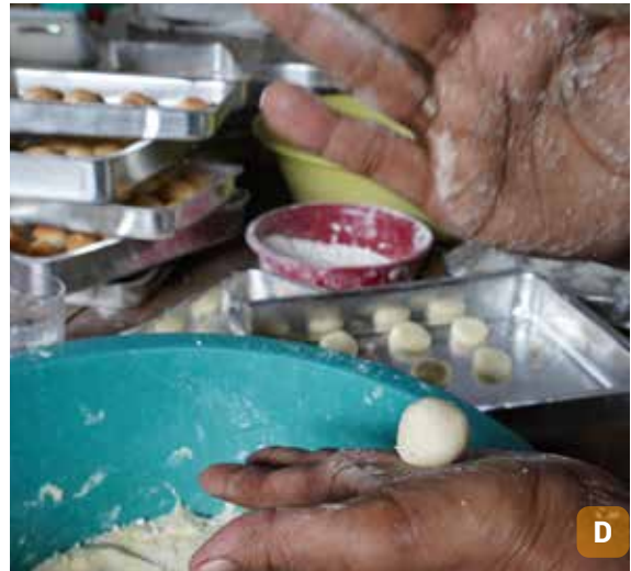
Figura 16. Beiju molhado (A); sario (B); pé de moleque (C); bolacha de goma (D).