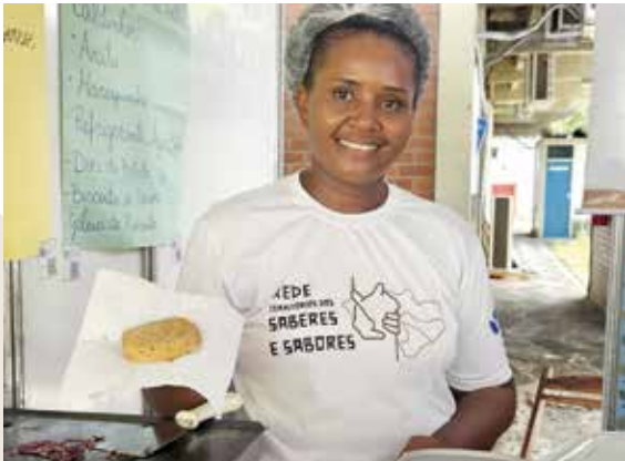
Figura 27. Hambúrguer de Aratu da Anatólia.