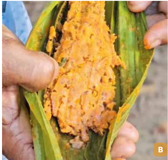
Figura 22. Preparo de catado de aratu (A); aratu na folha de patioba (B).