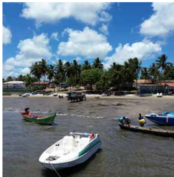
Figura 21. Cenários do Pontal de Indiaroba.