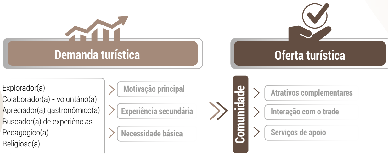
Figura 8. Diagrama da relação entre comunidade, demanda e oferta turística.

os aspectos comportamentais, como: canais de informação, meios de compra, motivações principais e sazonalidade da visitação.