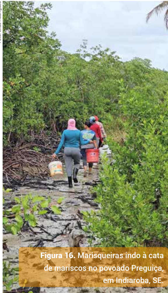
Figura 16. Marisqueiras indo à cata de mariscos no povoado Preguiça, em Indiaroba, SE.