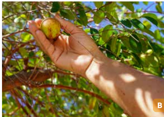
Figura 3. Catadoras de mangaba de Indiaroba (A); colheita da mangaba (B).