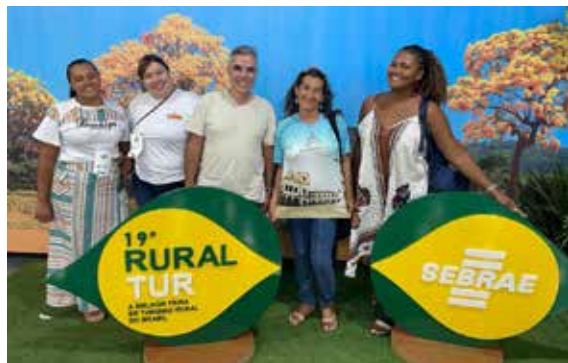
Figura 13. Participação das representantes de Sergipe na Ruraltur 2023.