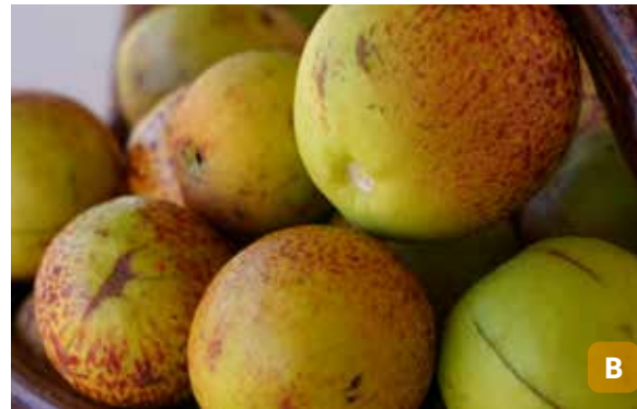
Figura 19. Pé de mangaba (A); mangabas colhidas (B).