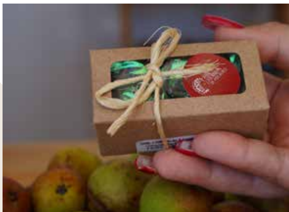
Figura 24. Souvenir gastronômico de Preguiça.