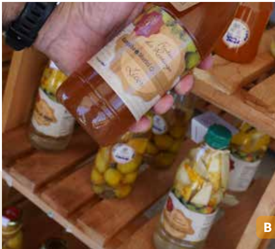
Figura 18. Delícias à base de mangaba elaboradas pela Ascamai: amanteigados de mangaba (A); licor de mangaba (B).

Conheça a Arena Mangabeira, espaço natural dedicado às trocas de experiências. Ali, as catadoras falam sobre os pés de mangaba, seus frutos e a relação com o meio ambiente. Cantigas tradicionais, histórias e curiosidades compõem o percurso, encerrado com uma roda de conversa à sombra das mangabeiras (Figura 19).