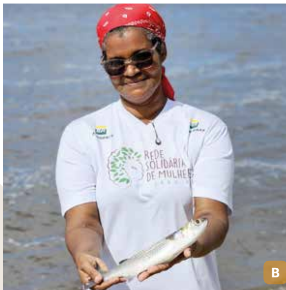
Figura 20. Pescadores artesanais no Rio Real (A); pescado típico do Rio Real (B).

Navegue pelas águas do território e conheça ilhas, bancos de areia, manguezais, rios e o encontro com o mar (Figura 21).