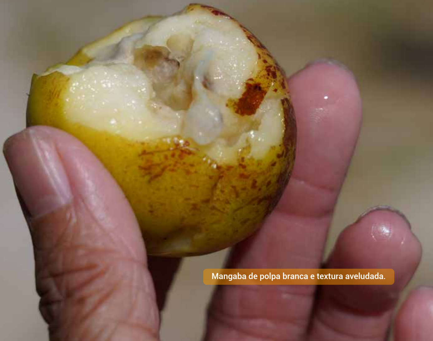
Mangaba de polpa branca e textura aveludada.