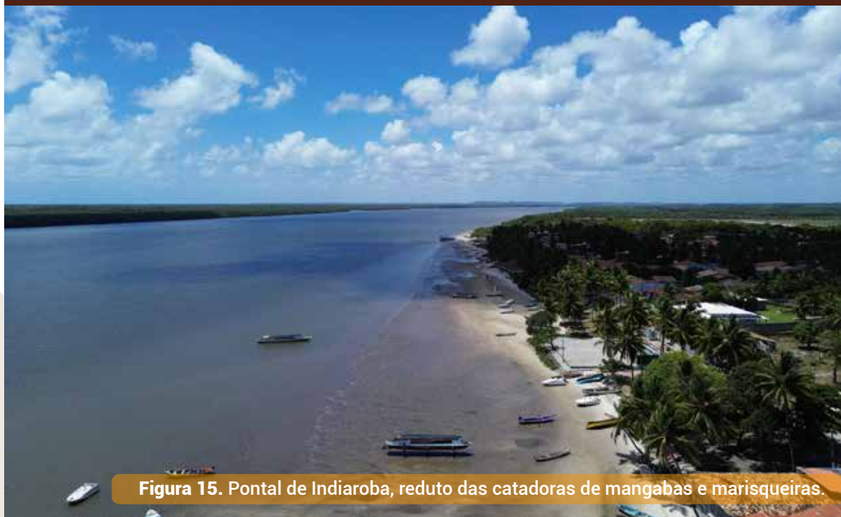
Figura 15. Pontal de Indiaroba, reduto das catadoras de mangabas e marisqueiras.

reconhecido como Patrimônio Cultural Imaterial de Sergipe. Os saberes e fazeres tradicionais dessas mulheres – que também são marisqueiras – transformam os frutos da terra e do mar em produtos agroalimentares únicos. Aproveite e leve consigo este símbolo da sergipanidade como lembrança da sua visita ao território.