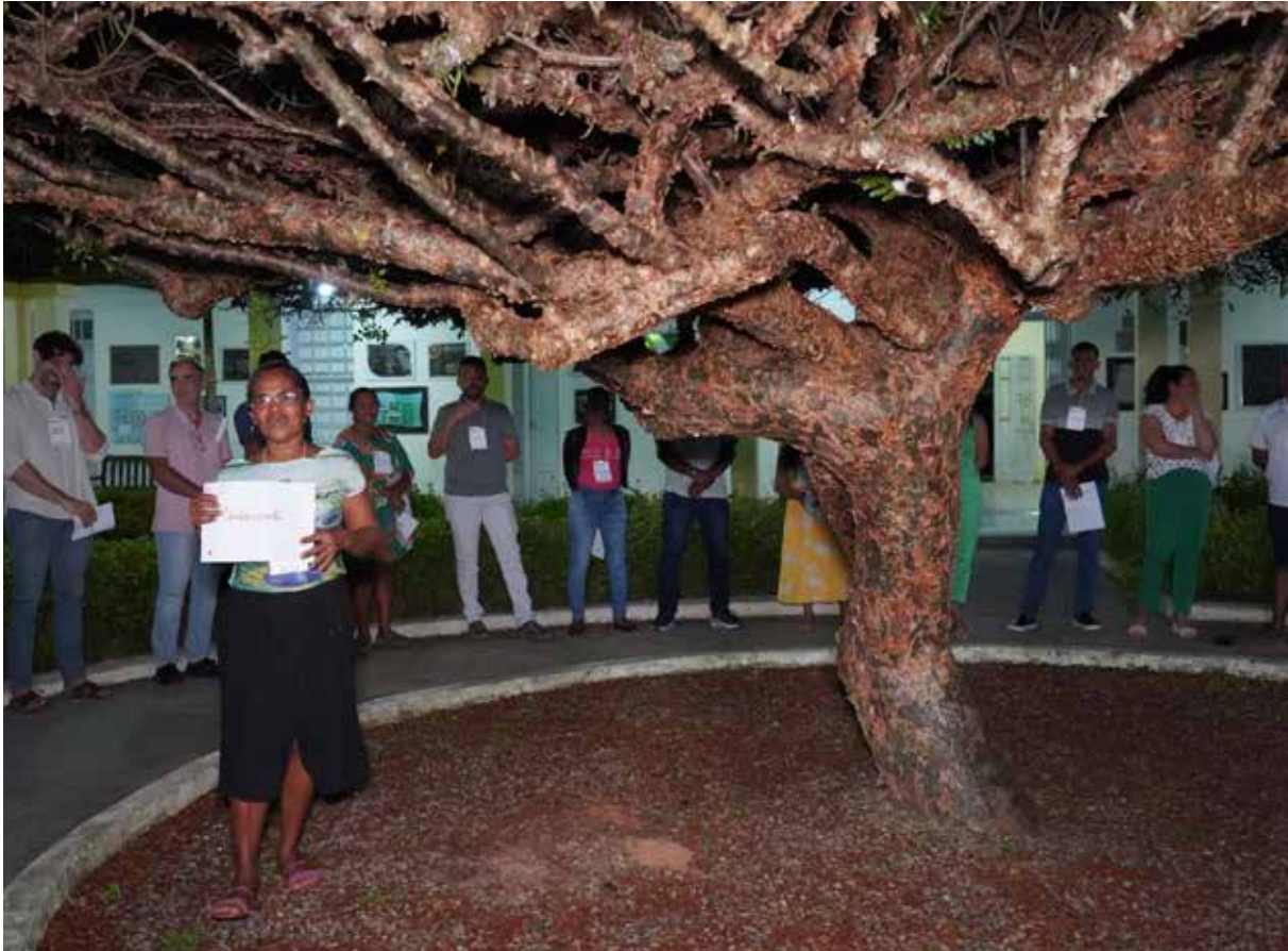
Figura 12. Visitas técnicas para troca de experiências: intercâmbio em Areia, PB.

ultrapassam as fronteiras estaduais, com destaque para a Associação Pegadas na Caatinga, que recebeu o grupo e apresentou seus produtos turísticos do sertão ala-