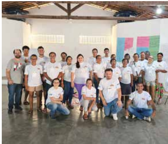
Figura 10. Oficinas realizadas em Indiaroba, SE.

D'Água do Casado, AL, proporcionaram vivências enriquecedoras e trocas de saberes. As feiras e eventos – como a Ruraltur e as feiras da Rede dos Saberes e Sabores – foram espaços estratégicos para divulgar produtos, estabelecer conexões e fortalecer o turismo comunitário. Essas ações integradas promoveram o empoderamento das comunidades e a sustentabilidade econômica e cultural da região.