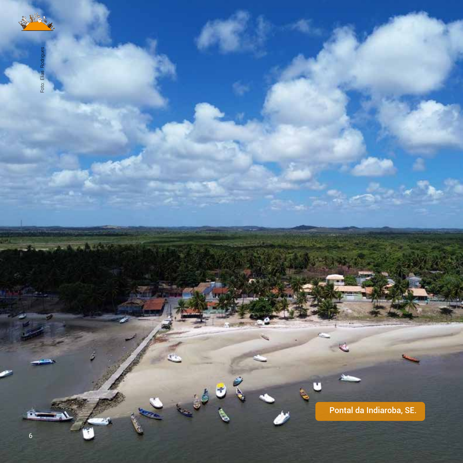
Pontal da Indiaroba, SE.