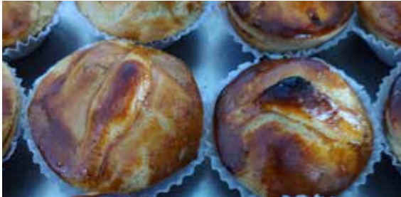
Figura 26. Empada de aratu do seu Pascásio.