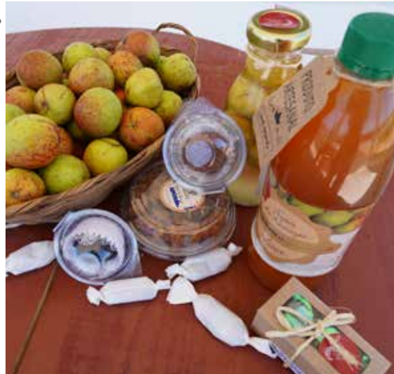
Figura 4. Produtos à base de mangaba.

as sociabilidades e as condições socioeconômicas locais. O principal elo entre as mulheres catadoras e o território é a própria mangabeira, que gerou meios de subsistência, fortaleceu sentimentos de solidariedade, incentivou o associativismo e despertou a consciência da luta coletiva.