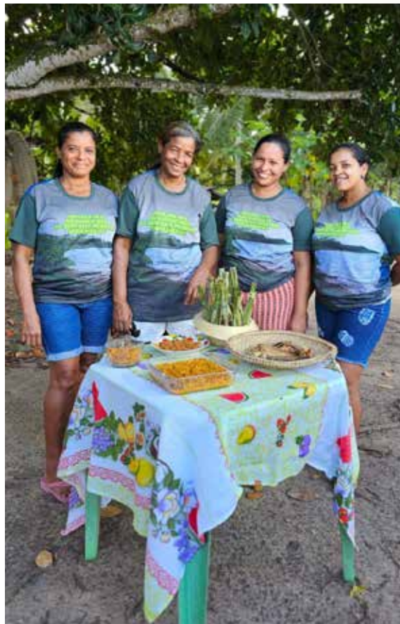
Figura 5. Protagonismo feminino no ofício das catadoras de mangaba.

Tanto nos lares quanto no setor de alimentos e bebidas, é possível encontrar mo-