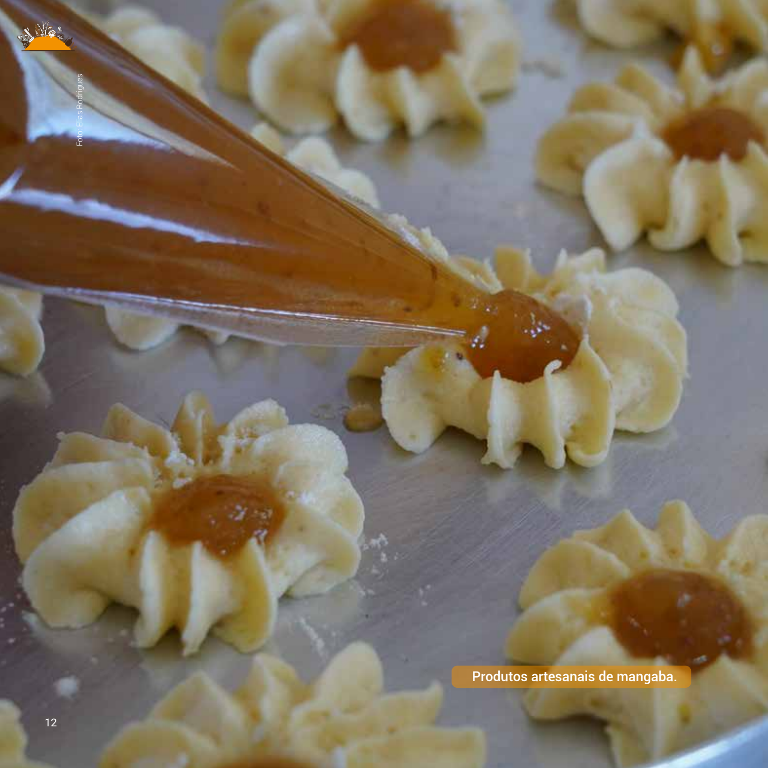
Produtos artesanais de mangaba.