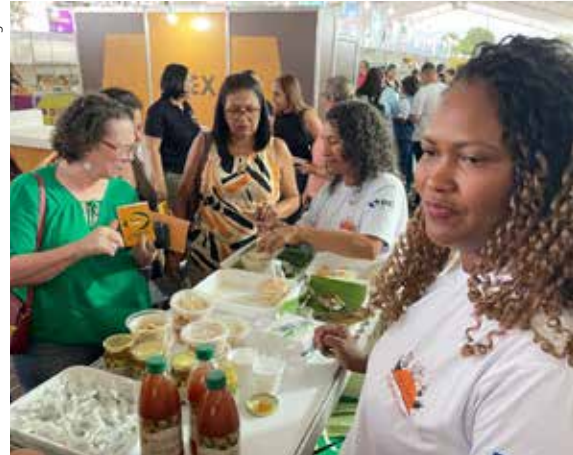
Figura 14. Estande da Embrapa na Ruraltur 2023, com a participação da Ascamai.