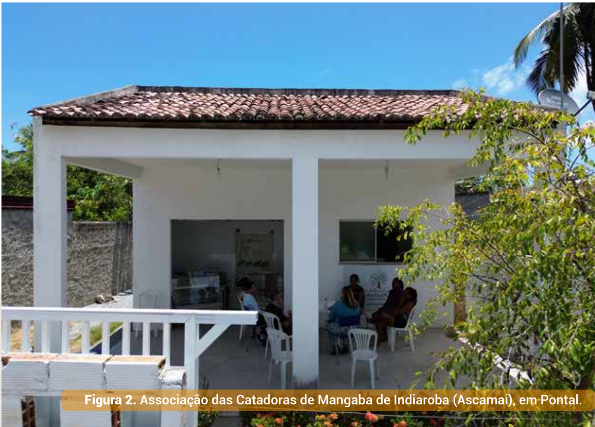
Figura 2. Associação das Catadoras de Mangaba de Indiaroba (Ascamai), em Pontal.