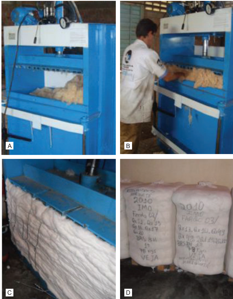
Figura 4. Detalhe da prensa e seu funcionamento: (A) masseira da prensa (componente que faz a pressão na fibra); (B) prensa realizando uma das prensagens sobre a massa da fibra na caixa; (C) porta aberta da caixa e amarração do fardo com arame; (D) detalhe do fardo pesado e caracterizado com os panos de proteção amarrados um com o outro.