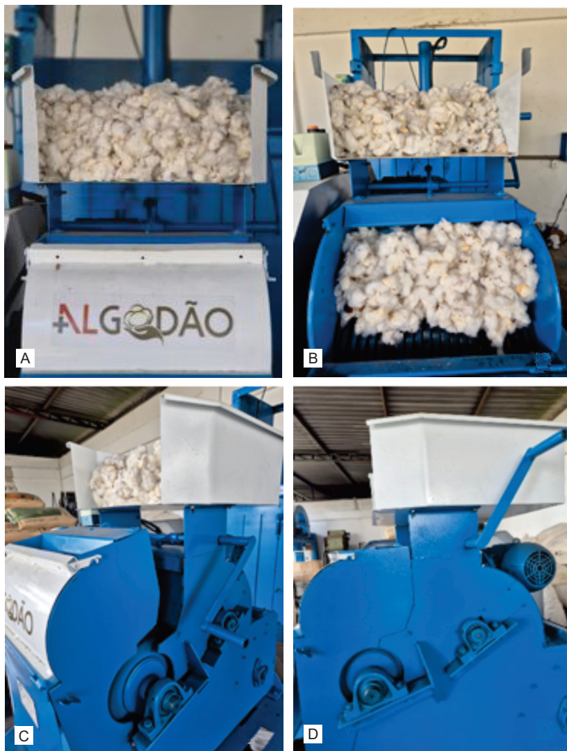
Figura 2. Detalhe do procedimento inicial para o descaroçamento: (A) abastecimento do depósito; (B) formação do cilindro de massa de algodão na câmara de descaroçamento; (C) detalhe da alavanca na posição inativa; (D) detalhe da alavanca na posição de ativa, em pleno funcionamento.